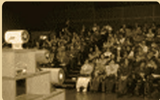
2006年12月 第40回「演奏家のいない演奏会」東京国際フォーラムにて200名のお客さまと。