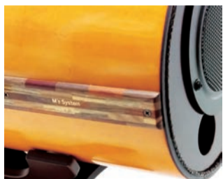
新発売ギター仕上げ セヴィリア SV1001 背面のパネルはアンプ同様、箱根の奇木細工仕様 ¥159,000

※波動的スピーカーの魅力は、「聴く場所を選ばない」ところだ。普通のスピーカーだとどうしても聴く場所が限られてしまいが、これは正対して聴かなくても、空間に音が満ちてくるのでいわゆるステレオ感とかの意識はいらぬ、ギターやピアノなどの響きが実にふくよかで普通のスピーカーでは味わえない、ライブ会場にいる感覚になる。その意味では今までのないスピーカーだ。その音に身を委ねれば至福の時間。