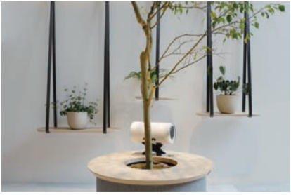
リラックス空間を実現するピアノホワイト MS1001-PW ¥180,000

エムズシステムのスピーカーは熟練の職人さんにより「一本丁寧に手造りされています。まさしく楽器作りにも似た工程を経て、空間全体に満ち渡る豊かな音色を響かせます。 サステナブルという言葉の通り「一生もの」の楽器として、親から子へと受け継がれて行くような今までは無かった新しい、そして美しいインテリアアイテムとも呼べるでしょう。