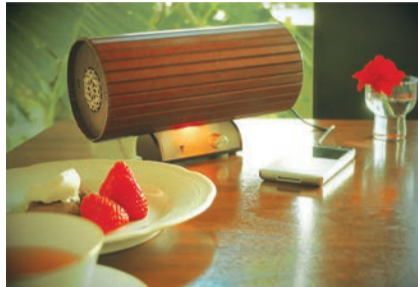
おうちカフェにぴったりしたショコラ ¥98,000

※我が家の食卓が高級レストランになりました。妻にも大好評で、良かったです。ありがとうございます。