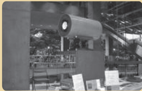
2003年9月東京国際フォーラム「ジョアン・ジゼルベルト」初来日のコンサート会場でMS1001発表