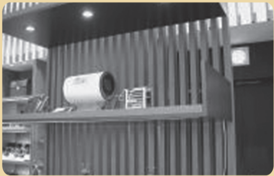
2005年3-4月 新宿伊勢丹・メンズ館全館でアンプ内蔵型「シュエット」を発表