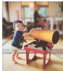
包み込むような優しい音

何で差がつくか？何を改善すると、もっと快適になるのか？という視点での進化を考えてみると、例えば映像はどっだったか？ハイビジョンからフル、3Dと寄り道をして4、8Kと進んできました。