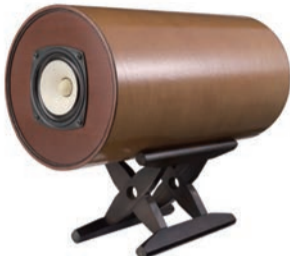
初号機MS1001 当時の台座は「糸巻」が使われていました。今は1001クラシックの名前で注文生産品です。 ¥120,000

ばらく聞かせたら、感動して動けなくなりました。今度は自分のCDを持って帰るのでもゆつくり聞かせて欲しいといわれました。他のオーディオも持っているが、どういいう訳だか、どういいう風になっているのかうまく言えないが、確かに違う。切れ味が違う。今も目の前にあります。大変楽しませてもらっています。これからますます良くなっていくように思います。いい物を買わせてもらった。有難う。