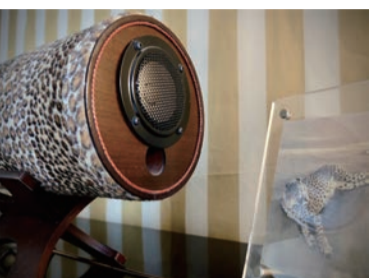
シーズン限定の特別品も発売しています。パンサー柄は完売。

※やわらかな音で、とても満足しています。音量が小さくても、大きくなるととてもいい音が出るのが良いと思います。