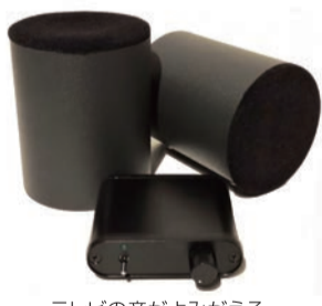
テレビの音がよみがえるテレビ専用スピーカーセット MTVS ¥63,000

少し高価ではありますが、引き換えに得られる体験はそれに十分値するものでした。このスピーカーは同じよう