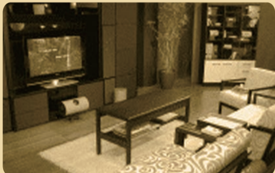
2007年4月 5.1chホームシアターセット「ドコデモ」を東京ビッグサイトにて発表