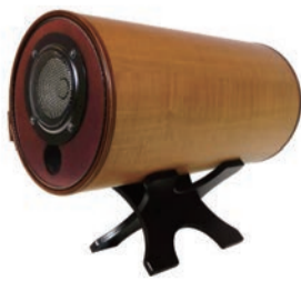
現行のメイン機種 MS1001-M ご家庭のリビングから店舗、オフィスまで、これ1台で安心安全のスタンダード ¥129,000

この素晴らしい音はもうろん患者さんのためでもあるが、患者さんたちは私からパワーを得ようとしてここに来ている。治療を助ける私自身が元気でなくては、どうして患者さんたちを元気に出来るだろう。そのために私はこのスピーカーをいつも流し、聞いている。自分で自分を治すパワーを湧き上がらせてくれる何か、それを自己治療力と呼んでいるが、その力を活性化させてくれる何かがある。このスピーカーにはある。