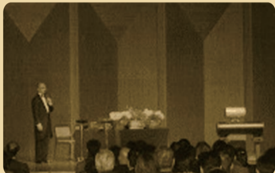
2008年8月 第100回「演奏家のいない演奏会」をサントリーホールにて開催

目の前でリアルに演奏されているかのような臨場感ほもちろんまるで音に優しく包まれていくかのような不思議な感覚を得られ、寝る前に聞くといつもよりも深い睡眠に入ることができ、また朝起きて直ぐに聞くとまるで全身の細胞に栄養が届いたかのように一瞬で目覚めたりとどんなシーンでも多様な体感を得ることができるので購入してからも驚きの連続です！