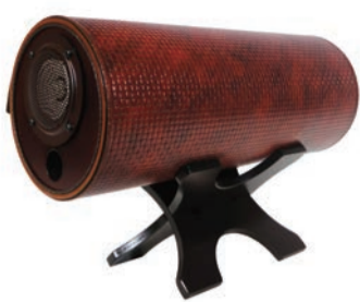
MS0801-イタリアアンゼー仕上げホテルのスイートルームに導入された豪華、重厚な仕上げ 残りわずか ¥160,000

※2年前の妊娠中、ひどい悪阻(つわり)のなか試聴伺い、試聴中は悪阻がなくなることに驚き、購入させていただいたものです。私はコロナ以前から患っていた化学物質過敏症という病気のために、ずっとライブはもちろん、外出自粛状態でした。他人の柔軟剤において発症してしまつたため、人の集まる場所にはなかなか行くことはできませんでした。