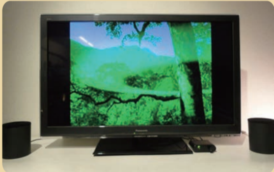
2016年11月 「テレビの音声がかえにくい」というお客様の声にお応えして、テレビ専用スピーカー-MTVS発売