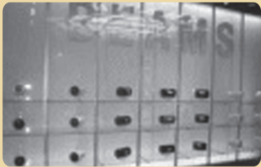
2005年5-6月ビームス心齋橋で24台の「シュエット」を巨大ショーウィンドウに展示キャンペーン