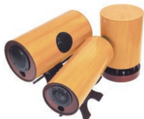
5.1chサラウンドシステムホームシアター 映画館よりはるかにバランスの取れた気持ちの良い、そして迫力のサウンド「ドコデモセット」 ¥320,000

※ドコデモセットがリビングにあると、もう外出する必要がなくなる。映画館もライブコンサートも、そしてリビングにもこのセットさえあれば、このリビングからすべての施設に、旅先に連れて行くことができる。空気そのものをさえ変えてくれる。ドコデモアを開けるように、簡単に時空を超えてその場に連れて行くことができる。