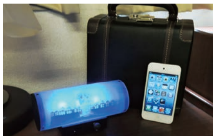
このサイズからは信じられない豊かな音色が広がりますカゲエスピーカー ¥58,000

※こんなにコンパクトでしかもインテリアとしてもキュート。臨場感もある音色、耳にやさしくリラックスできるのもいいですね。