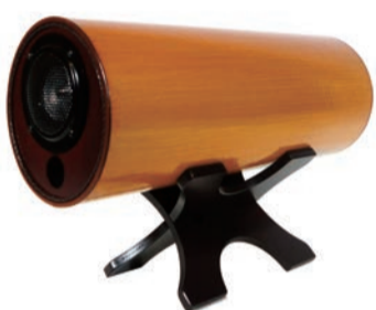
RS0802 手塗り MS1001より一回り小さくて軽い ¥93,000

※豊かな音が生活にこんなにも潤いを与えてくれることを改めて実感しました。部屋の空気が柔らかくなり、人が本来もつ優しさを引き出してくれるスピーカーだと思いました。忙しい現代人にとって、この音が流れる空間はオアシスだと思います。