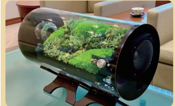
2018年 大型スケルトン人気を呼ぶディスプレイしたいものをお預かりして世界で唯一のオリジナルスピーカーを。

ではの魅力もあり、付加価値の高さを再認識しました。じっくり付き合っていきたいと思っています。