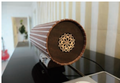
インテリアにもアクセントを与えるパニア ¥98,000

往年のスターのジャズの名演奏に酔いしれ、その後に出逢ったショコラとパニア。最初はショコラの見え目の愛くるしさに魅かれ、そしてパニアが登場するとショコラを上回る可愛さで、音の素晴らしさに感動し、気付けば自然と涙が溢れていました。