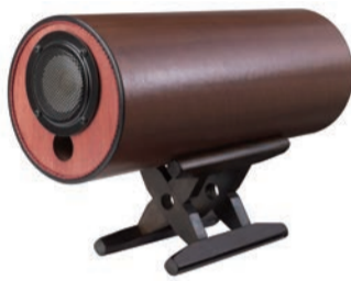
MS0801 こちらの台座も「糸巻」ですね。少しかたつきがありますが趣きも感じられます。こちらは惜しまれながら廃盤に。

ーカーの存在を消す」というところにあるのではないのでしょうか。目をつむって聴くとコンサート会場にいるような気分が眠りに誘われる、そんなエムズシステムを生涯の友としてこれからも使い続けるつもりです。