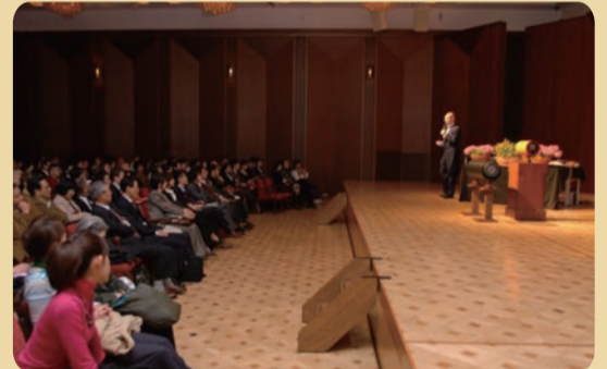
2010年4月 第177回創業10周年記念「演奏家のいない演奏会」をサントリーホールにて開催