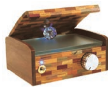
箱根の奇木細工の職人さんにひとつずつ丁寧に作って頂いている逸品のボディ。その性能は40倍の大きさ、50倍の重さを持つアンプよりはるかに繊細で表情豊か。¥122,000