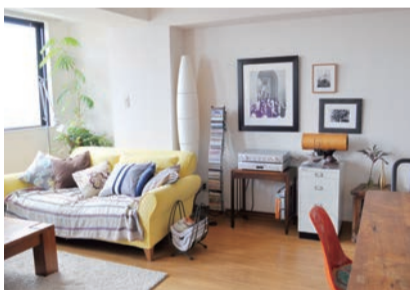
インテリアに馴染むナチュラルな仕上り

肝心な音響の導入で完璧！長時間聴いていても疲れない自然な音のスピーカー。これが重要です。一度エムズシステムのスピーカーで楽しんだら、いままでの視聴はいつい何だったんだ！と思えるほどリアルな臨場感とお声を頂いています。