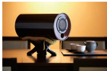
美しい本格漆塗り仕上げ MS1001333 ¥240,000

※主張しないのにちゃんと入ってくる素晴らしい音。音が柔らかい。一瞬間聞いただけで今までが何だっただろうと思うほどの衝撃を受けました。