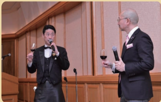
「2019年3月第400回記念 演奏家のいない演奏会」を帝国ホテルの間で開催。波動スピーカーの音色を聞く前と後ではワインの味が変化するというワインテイスト付き。帝国ホテルのトップソムリエも登場