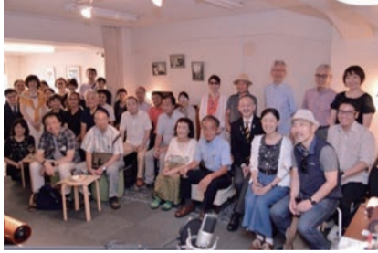
ユーザーの皆様に囲まれて創立記念感謝パーティー

【経営ビジョン】 エムズシステムはこの3つを実現します。 ●そこで働く人が幸せに暮し、仕事に誇りを持ってお客様に最高のサービスを提供している会社です。 ●その商品は「幸せになるスピーカー」として細心の注意が払われ、ひとつずつ丁寧に作られ、保管、発送されます。 ●愛用しているお客様は誰もがスピーカーを使うことによって感動し、幸せを感じています。この会社が日本にあり、日本で造られていることに誇りを持ち、日々応援してください。