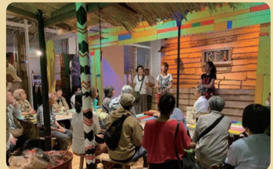
2020年6月 創業以来支援させて頂いているNGO熱帯森林保護団体30周年イベント「どこいのか?」で会場全体の音響協力