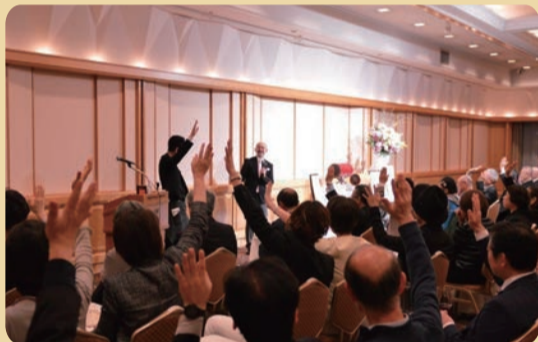
参加者200名そしてソムリエも大きく手を挙げて「味が変わった!」と。音のエア・コンディショナー効果を実感