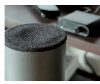
置き方、聞き方自由自在！設置、接続もかんたんに。MTVS ¥63,000

※老いた母の楽しみはテレビを見ること。ところが音声が届き取りにくく、大音量で鳴らしていました。手元スピーカー、肩掛け無線式スピーカー、サウンドバーと3種類も購入しましたが、どれも満足していませんでした。あきらめかけていた時にMTVSに巡り合い、これが最後だと購入したところ母がとても喜んでくれました。ありがとうございます。