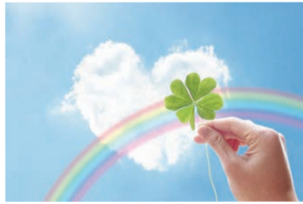
幸せの波動が世界に広がれ!

この絵に付けられた長い題名は、私自身に突きつけられた根源的な問いであり、同じように、起業した者にとっても本質的な逃れられない問いかけをされていることになりました。存在の理由を問いかけてられているからです。 この会社は何のためにあるのか?どこへ向かっているのか?