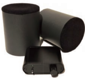
置き方、聞き方自由自在！設置、接続もかんたんに。

【スピーカー】●サイズ/直径9cm×高さ11cm●重さ/394g×2●再生周波数帯域/f0~20kHz●インピーダンス/4Ω●許容入力/10W●ケーブルの長さ/左右各1m【アンプ】●サイズ/高さ2.5cm×幅8cm×奥行8.5cm(つまみ含む)●重さ/102g●入力端子/ステレオミニ端子●実用最大出力/2W×2【付属品】●ACアダプター(1.5m)、ステレオミニケーブル(1m)