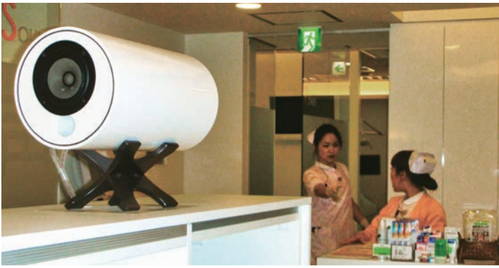
病院や歯科医院にも導入されている『MS1001-ピアノホワイト』

地上に満ちる自然の音はすべて360度ひろがる拡散性のバランスのよい音に包まれていました。対して140年前に生まれた人工物であるスピーカーの再生する音は直進性、指向性を持っています。そして今、私たちはこれらの再生音に囲まれて生きています。