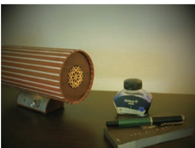
インテリアにもアクセントを与える「SLA パニラ」

法に「来週、もう一度、ここに来てくださいますか。私だけで決めるとね、まずいでしょう。みんなにも聞かせてあげたいので、もう一度、こんなふうにライブを聞かせてください」と仰る。こうして1週間後には、エムシステムのスピーカーをご使用いただくこととなりました。