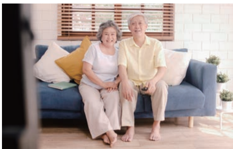
テレビの音がよみがえる「MTVS」

エムズテレビスピーカーも同様です。設置は、「実は、電気オンチで、接続なんて」という方でもかんたんに接続できるシンプル設計。テレビのイヤホン端子につなぐだけで、テレビの音が蘇ります。テレビってこんなにいい音が来ていたの？と改めて感動してしまうかも知れません。あなたの大切な人に心豊かな、最高の音を贈りましょう！