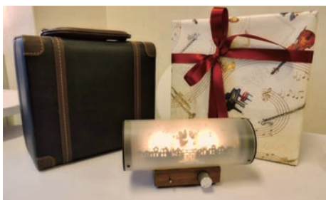
どこへでも持ち運び便利なキャリングケース付きカゲエスピーカー ¥58,000

しかも使い方はとっても簡単。これ以上簡単にできないほどのシンプル構造です。スマホやパソコン、タブレットに接続するだけで、驚くほど豊かな音色が空間全体に満ち溢れます。