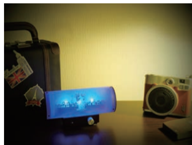
「Kagee (カゲエ) 天使のまほう 青」