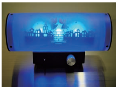
この手の平にのるサイズからは信じられない豊かな音色が広がります

分の使っているスピーカーが海外のテレビに映っているものだから。こう言っちゃ失礼だけど、それほど有名でもないスピーカーがなんで、シンガポールで流れているだろてね。真剣に見ましたよ」 NHKの海外放送の「グレートギア」という番組で「クルルジャパン」の製品を紹介する