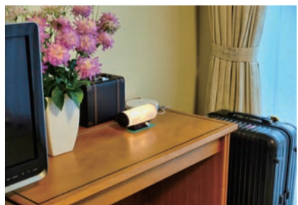
入院個室にカゲエスピーカー

「すべてはバランスですから、常に副交感神経が優位の状態にある必要はなく、日常生活においては交感神経と副交感神経が交互に働いてバランスを取っているわけですね。ただ、日中の活動は交換神経に偏りがちなので、副交感神経が優位の状態にするように心がけることでバランスが取れるのです。」 「もう一つ、副交感神経が優位の状態は睡眠です。」 「この間に心身をリフレッシュさせ、壊れた細胞などを修復します。」 「お風呂に入ったり、マッサージを受けたり、深い呼吸をすることなどによっても、その優位な状態が保たれるのですが、気持ちよく音楽を聞くこともとても効果的なのです。」 「このスピーカーはまさに、こつこつとした効果があるように思われます。」