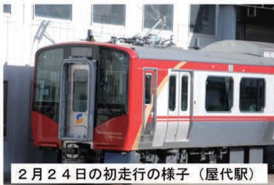
2月24日の初走行の様子（屋代駅）

屋代駅構内での初走行を行った2月24日には構内で記念グッズを販売。鉄道ファンの家族連れなどが詰めかけて新車両を撮影していた。