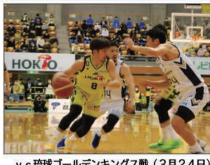
v s 琉球ゴールデンキングス戦(3月24日)

信濃グランセローズ 昨年同様3地区制で戦うBCリーグ。グランセローズの長野県営球場でのホーム開幕戦は4月10日の福島戦。18日はオリスタに新潟を迎え撃つ(13時開始)。