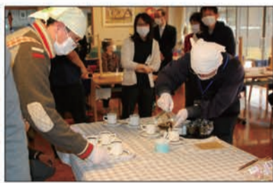
この日焙煎した豆は深煎りのタンザニア

コーヒーマスターのサービスを提供した。今回訪れた市内戸倉のアハウス千曲では食堂で施設利用者らが焙煎の様子を見学。その場で淹れ立てのコーヒーマスターを味わった。利用者からは「コロナで大変な時代だが、ゆっくりとコーヒーマスターの味を楽しむことが出来た」と好評だった。