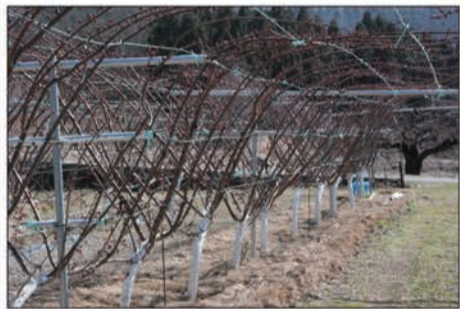
枝全体に日光を当てる「樹体ジョイント栽培法」

あんずの里を維持していくための新たな模索と挑戦。伝統に新しい技術を接ぎ木していく森の杏に未来への可能性を見た。