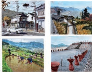
信州千曲観光局などで販売

ケーブルネット千曲 GUIDE 毎月1日新聞折り込み 長野州ケーブルテレビジョン ☎ 026-272-1660