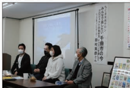
クロストークの様子

講演には千曲市で活動する様々な団体や個人20名ほどが参加。クロストークのコーナーでは出席者が地域での活動内容を互いに紹介したほか、活発に意見交換を行った。