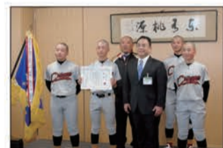
練習拠点の万葉の里スポーツエリアは台風被害に遭ったが逆境を乗り越えて全国出場を果たした

3月26日から行われる日本少年野球春季全国大会に出場する千曲ボーイズの監督・選手が小川市長を訪問した。今回で5回目の全国挑戦となる千曲ボーイズは目標のベスト8を目指す。