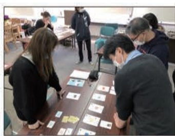
カードゲームの様子

ちくま未来サロンVOL.20「カードで学ぶSDGs」が3月14日開催。このカードゲームは参加者にそれぞれNPO、行政など一つの「ミッション」が与えられる。そのなかで個々のSDGsのテーマに沿った複数のプロジェクトを達成していくというものだ。プロジェクトを進めていくためには他のチームとの交流が不可欠となる。他団体との協力で目標を達成していくリアルな感覚を経験できる。ゲーム終了後参加者の一人は「小学校でも実施してほしい」と話していた。