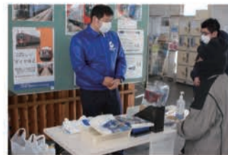
記念グッズの販売（屋代駅）