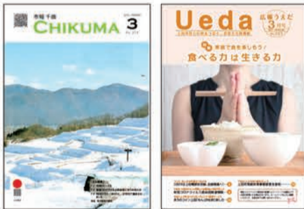
千曲市市報(左)・上市市広報(右)