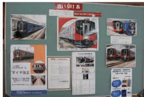
屋代駅構内では詳しい性能も紹介

当初は全車両がSR1に置き換わる予定だったが、昨年来の新型コロナウイルスの影響で導入台数が削減。現在およそ3割のダイヤでこのSR1の車両が走っている。しなの鉄道によるとこの200番台の車両は揺れが少なく、エアコンも完備されており快適な乗り心地が楽しめる。このこと。是非一度乗車してみた。