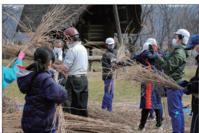
茅を手で「すぐる」葉取りの工程

千曲市羽尾にある「さらしなの里」の里古代体験パークで3月5日、復元住居の修理が行われた。今回は地元更級小学校6年生の児童25人が総合的な学習の時間を使って参加。例年だと10月に行われる縄文まつりに参加する予定だったが、新型コロナウイルス感染拡大により祭りが中止に。学校行事も少なくなるなか、ちょうど復元住居の修理のタイミングに合わせて手伝いを行うこととなったものだ。