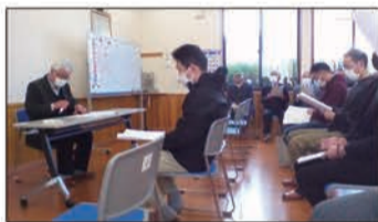
区総会の様子(屋代)

千曲市内に72ある区・自治会の令和2年度総会が3月の年度末にかけて各地域で行われた。今年度は新型コロナウィルスの感染拡大により、千曲川クリーン作戦や水路の浚渫事業が中止。市民運動会や総合防災訓練なども取りやめになったほか、親睦旅行などを見合わせた地区も多い。住民自治の活動に大きな影響が出た一年となった。