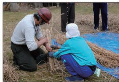
丁寧に一つずつ茅を束ねていく

作業は班ごとに分かれて小谷屋根の茅葺職人の指導を受けながら行われた。「茅葺はすべて土に還るもので出来ている」とか「ひとつの住居につき茅の束が1000本ほど必要になる」といった職人の説明にみな真剣に耳を傾けていた。