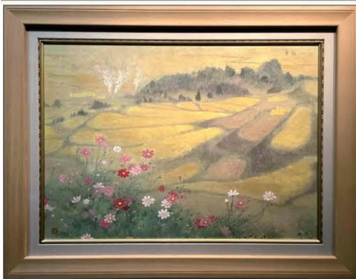
倉島重友 (千曲市名誉市民・日本美術院同人) 豊穣の棚田 2020年作 30号

日本遺産に認定された「姨捨棚田」、作者が初めて描いた故郷の光景。黄金に輝く稲穂の波、刈り取られた棚田、はげ掛け、三筋の煙。よく見ると畔には吾亦紅、そして豊かな実りを歓喜するが如くコスモスが咲き誇っている。稲穂も畔も棚田も森も全てが豊穣の色、黄金に包まれている。