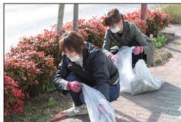
街路清掃の様子(屋代駅前通り)