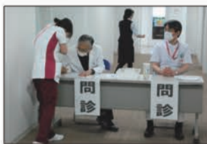
最初に問診を終えてから(上)接種を受ける。接種後は副反応に備えて別室で15分ほど待機する。

千曲市内の医療従事者を対象とした新型コロナウィルスワクチンの接種が始まった。3月15日、市内杭瀬下の千曲中央病院で接種を受けたのは医師、看護師、技師ら150名。接種は25名ずつ6つのグループに分かれて実施され、およそ2時間ほどで全員が完了した。ワクチンは基幹病院の篠ノ井総合病院から届けられていて、3週間後の4月5日には2回目の接種が行われる予定。