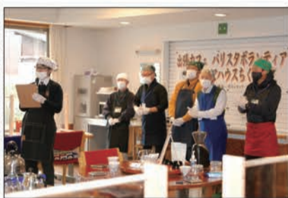
今回の受講者は40代～60代の16名

千曲市社会福祉協議会では団塊世代の男性を対象に地域福祉活動講座を開講。「珈琲福祉」と銘打ち2月からコーヒーマスター・バリスタのレクチャーを実施した。川中島のコーヒーマスター「Piano Piano」のオーナーを講師に招き、2回にわたり座学と実技を学んだ受講者は3月8日、実際に福祉施設を訪問。