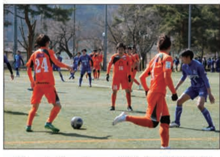
トレーニングマッチ vs アザリ-飯田(3月7日)