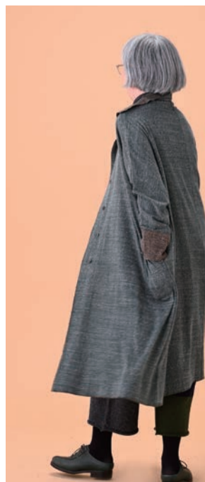
11 D グリン