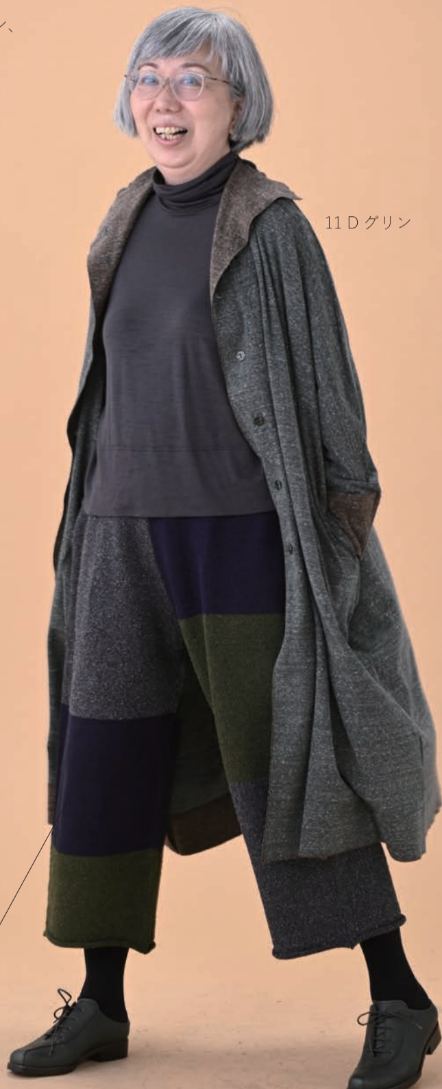
11 D グリン

LENGTH : 身丈 104cm、身幅 81cm、 衿丈 73,5cm (±1cm)