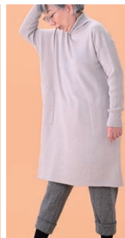
730 S グレー