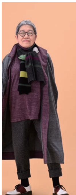
15 チャコール (14 ワイン / カットソー配色ブル)