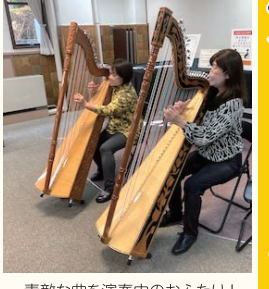
素敵な曲を演奏中のおふたり!

アルパとはスペインでハープのことです。日本では南米の民族楽器のハープを称してアルパと呼んでいます。アメリカ大陸発見後スペイン人がキリスト教の布教時に持ち込んだハープを現地の先住民が真似して楽器を作り演奏を始め、それが民族楽器として定着しました。