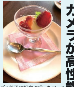
よく普通に記念撮ったファミレスのデザートですきれい！

④ 脳トレも得意 スマホには脳トレができ るアプリが大変多いのも 魅力です。種類はなんでも あり！囲碁将棋・漢字 書き取り・計算・パズルや 間違い探しなどたくさん 種類があります。 体力気力ともに脳トレ も挑戦してみましよう！