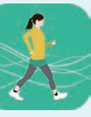
↑アイコンはこれ。100万ダウンロードの人気アプリ会員登録なしで利用可能。最初に身長・体重と目標とする歩数を入力だけ。