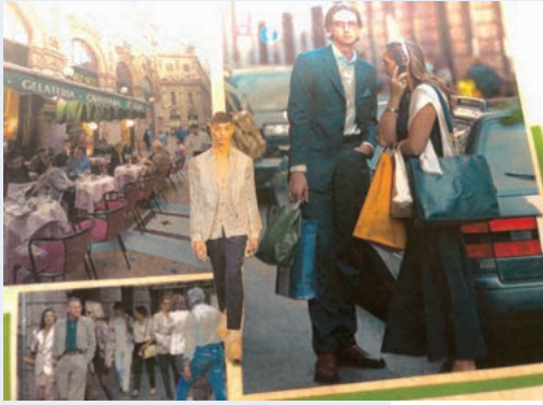
(文・写真 倉屋ゆうじ)

今季はしなやかな薄地やきれいな色でごく軽やかに仕立ててあるのがポイントな気配を感じる。