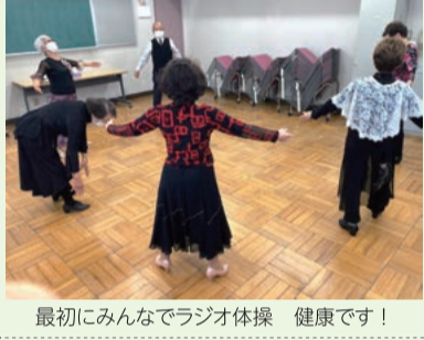
最初にみんなでラジオ体操 健康です!

仲良しダンスクラブ こちらは平成元年(1989年)の綱島地区センター開館から始まっている歴史のあるダンスクラブです。