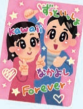
カメラの他にも加工の技術も最近では大きく進歩しています。

若い人が撮影されているプリクラが最近進化しています。当初は証明写真がシルになっただけでしたが、最近では