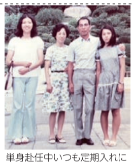
单身赴任中いつも定期入れに

父の仕事は鉄道関係で母はしっかり勉強を、と厳しく育ててくれた。それでも「僕の成績はあひるの行列(2の行列)だよ」と周囲を明るくする言葉を屈託のない笑顔で語る。 小学3年生頃始めた柔道は中学校は黒帯の腕前。また海が近いこともあり瀬戸内海で泳いでばかりいたことから水泳、特に日本泳法が上手で、海軍の兵士に泳ぎを教えたこともあると得意げに話す。「ちいちゃい頃は毎日海辺や山をみんな走り回っていた。あの頃は楽しかったなあ、好きな女の子もいたんだよ」と明るく語る。