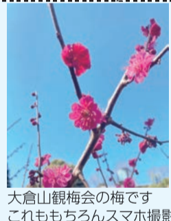
大倉山観梅会の梅ですこれももちろんスマホ撮影

この画素というのは1枚の写真や印刷物が何個の色を持つかで表現在されているかということです。この画素数が多いほど写真などは細かい色合いが繊細に表現され美しくなります。