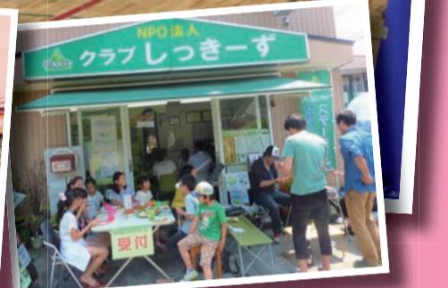
名物イベントの大蛇ヶ淵頂上決戦