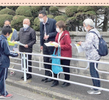
一下校中の中学生に丁寧に説明すると真剣に聞いてくれました。

さがしてネットとは、新吉田あすなろ地区と新吉田地区の2地域が協力して行っている取り組みで、先日、模範訓練が実施されました。認知症になると今いる場所がわからず帰宅