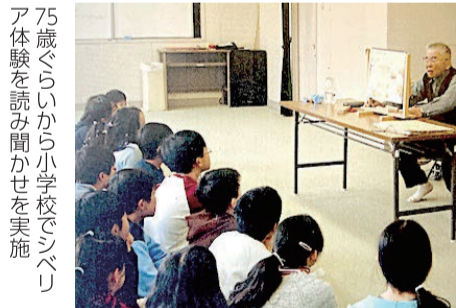
75歳ぐらいから小学校でシベリア体験を読み聞かせを実施

校も行っているし満足だよと話す。 若い方にアドバイスをお願いすると「人に迷惑をかけずに自分もできるだけの喜びそうなることをしよう」と心がけているよとの事でした。 70代からペン習字も続けている。これまで早淵川沿いを散歩してきた。 今はシルバーカーを押し、いなげやさんに1日おきに浄水を3本取りに行くのが日課。 60年前、庭を実が成る木や花の季節が長い花に植え替えた。お陰で子どもたちがいつも来ても楽しめる。 取材の締めくくりに一言お願いすると「昭和12年に盧溝橋事件が起きてから自分の人生は戦争の話題ばかり。いつも戦争に振り回されてきた。今、国内では戦争がなく幸せで平和であるから、少しでもこの期間を長く長く続けてもらいたい」と心を込めてお話をす成田さんでした。