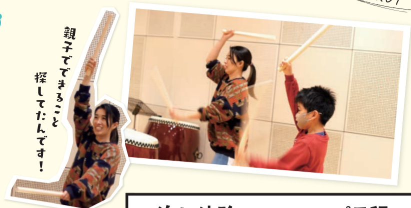
親子でできること探してたんです!