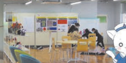
地元との交流の場 リモートワークもできる文化交流室