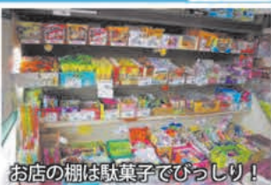
イベント出店のようす