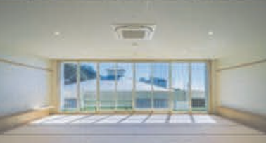
海も見える開放感あふれる客室

旧小湊小学校を改装し、2022年2月に誕生した「小湊さとうみ学校」で4月1日より新たに宿泊事業がスタートした。校舎の面影を残した交流棟では、3階に和室の大部屋5室、洋室の個室8室があり、最大116名が宿泊できる。2階にセミナーや研修・ミーティングなどに利用できる多目的室が大小7室。1階に食堂と大浴場、ランドリースペースも備えている。フットサルコート3面と8人制サッカーコートの広さを有する人工芝グラウンド、体育館は空調完備でバスケットボールやバレーボール、パドミントン、卓球などの設備が整えられている。スポーツ合宿だけでなく、サークル活動や講演、集会などにも利用できる。