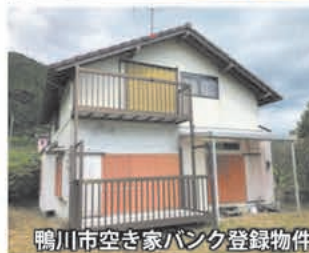
鴨川市空き家バンク登録物件

「移住のための家を探しています」「安く借りられる空き家はありませんか?」物件情報を求めて寄せられる相談が実に全体の8割を占めています。