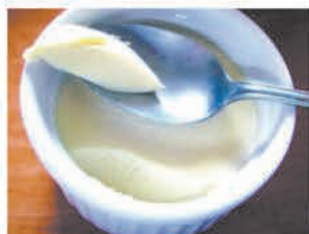
蒸しチッコカタメタノ

アジア型近代化遺産であり、「人々を元気に!」を牽引し続けた嶺岡牧は、世界の将来を築く導きの糸であり、世界遺産をしのぐ宝との評価を得ている。この嶺岡牧物語を構成する様々な文化を活かして地域を元気にする活動へ、自治体がサポートする体制の整備が希求される。