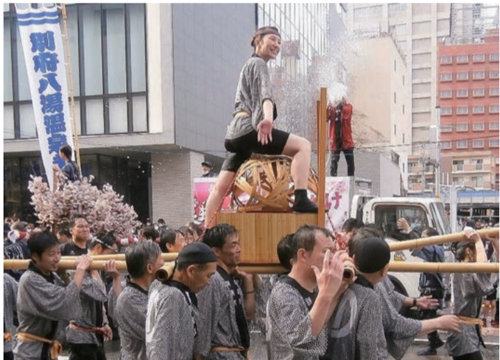
空から大量の湯が降り注ぐ「湯ぶっかけまつり」

4日間の祭りを通して、最大かつ最も人気のある祭りが「湯ぶっかけまつり」で、文字通り温泉の湯をぶっかける。今年は4月2日の日曜、午後3時開始だったので、当日少し早めに家を出て電車に乗り、3時前に別府駅で下車。駅前通りを見ると、すでに大勢の人でごった返していた。車の通行を禁止した通