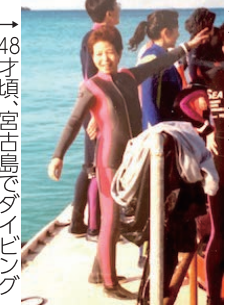
48才頃、宮古島でダイビング

卒業後インターンで 神谷町の愛宕山の美 容院で1年間働いた。 昭和46年念願だった 娘2人を引き取り、大 倉山で新生活が始ま り、昭和48年縁あって 3女が誕生した。 美容の仕事が続け ながら大倉山記念館 のボランティアに通 っていた。