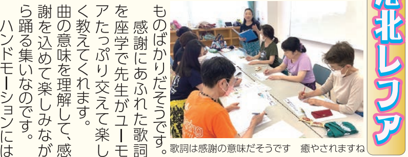
歌詞は感謝の意味だそうです 癒やされますね

感謝にあふれた歌詞を座学で先生がユーモアたっぷり交えて楽しく教えてくれます。曲の意味を理解して、感謝を含めて楽しみながら踊る集いなのです。ハンドモーションには意味があり、手話のように覚ええることで脳が脳トレのように活性化します。 そして中腰で踊ること、穏やかに見えるダンスもよく見ると筋力をとても使っているのです。