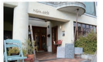
カフェ Nim.cafe (ニムカフェ)

〒657-0825 神戸市灘区中原通6丁目1-15 078-806-3707 定休日 火曜日