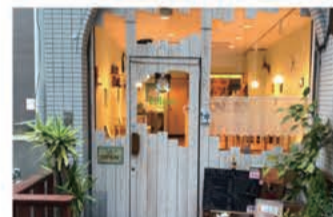
カフェ Teacafe Colour

〒657-0838 神戸市灘区王子町1丁目2-21 サンビルダー王子公園101 078-882-6010 定休日 木曜日