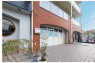
便利屋業 いつもの便利屋

〒658-0045 神戸市東灘区御影石町2-13-20-203 0800-888-4694 定休日 不定休