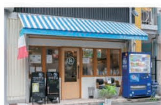
イタリアン Pizzeria RICCA

〒657-0838 神戸市灘区王子町1丁目3-23 レインボープラザ102 078-262-1292 定休日 水曜日・火曜日ディナータイムのみ