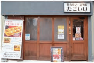
明石焼居酒屋 明石焼居酒屋「たこいけ」

〒657-0838 神戸市灘区王子町1丁目3-23 078-585-7350 定休日 月曜日・木曜日