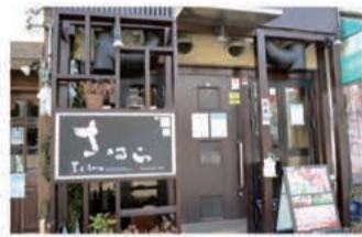
焼肉 黒毛和牛焼肉 さはら

〒657-0821 神戸市灘区赤坂通5丁目3-11 078-802-8929 定休日 月曜日 (月曜日が祝日の場合は火曜日休み)