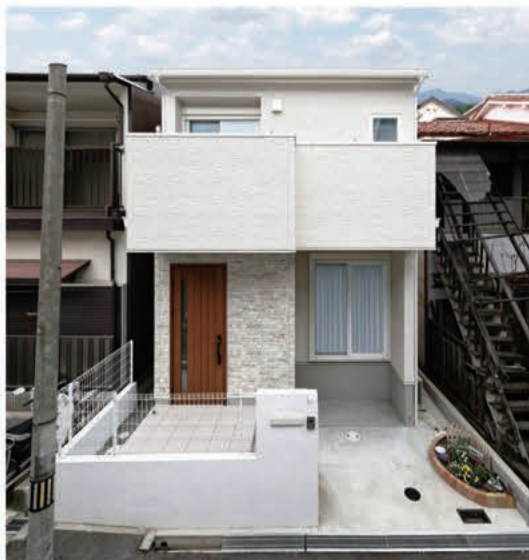
約23坪の敷地に建つ住まい。 動線をコンパクトにまとめました。