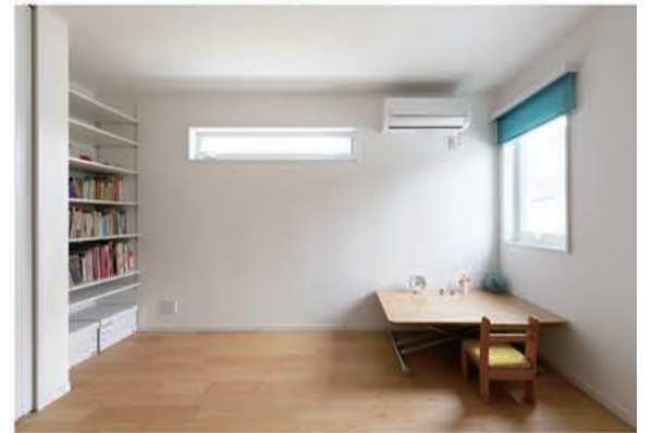
ゆとりのある子供部屋。