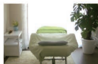
サロン メイクアップSiesta (シエスタ)