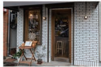
ワイン IN VIAGGIO (インヴィアッジョ)

〒657-0836 神戸市灘区城内通5丁目2-4 078-223-3689 定休日 不定休