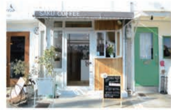
カフェ 朔コーヒー (サクコーヒー)