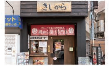
からあげ きしから 灘・岩屋店

〒657-0846 神戸市灘区岩屋北町4-3-10 1F 078-806-3550 定休日 不定休