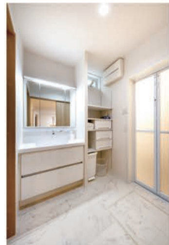
水廻りは白を基調とした清潔感あふれる空間に。できるだけ動線をシンプルにし、家事ラクにつなげました。