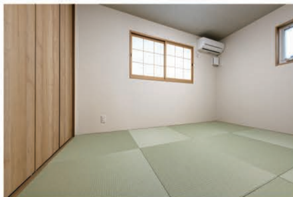
琉球畳を使用し、和モダンにまとめた和室。