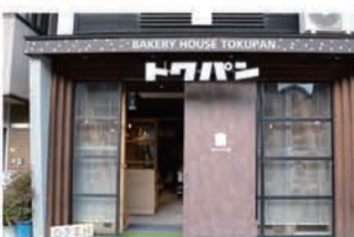
パン BAKERY HOUSE TOKUPAN

〒657-0846 神戸市灘区岩屋北町2丁目4-6 070-7489-3313 定休日 日曜日・不定休