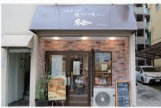
パン 食パン専門店 結-YUI-

〒657-0838 神戸市灘区王子町1丁目1-15 078-862-3900 定休日 水曜日