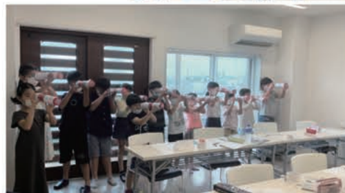
▲昨年の様子 ※今年の内容は異なります。