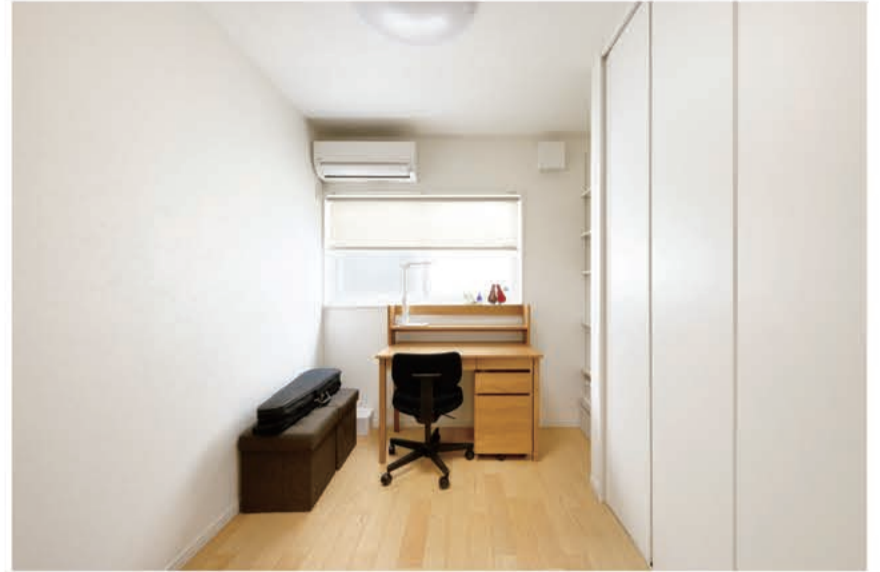
バイオリンの演奏や仕事など、フレキシブルに対応できる書斎。

A7. 私は2階に設置したランドリースペースが一番お気に入りです。このランドリースペースはベランダとシームレスにつながっていますので、洗濯機から出した洗濯物をすぐにベランダに運んで干すことができます。そのおかげで、以前マンションに住んでいたときと比べても、無駄な移動がなくなり洗濯にかかる手間が大きく軽減されました。また、夫はリビングから2階に上がる階段下のデッドスペースを活用した作業スペースがお気に入りのようで、この場所で日々の予定を確認したり事務作業をしたりする姿をよく見かけます。