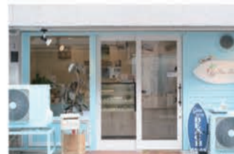
ケーキ 小さな菓子専門店 ファリリィ

〒657-0035 神戸市灘区友田町4丁目1-23 078-806-8242 定休日 不定休