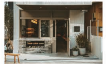
カフェ CHARMANT Cafe & COFFEE ROASTERY