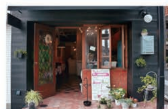
ガレット・クレープ LE MARRON (ルマロン)

〒657-0064 神戸市灘区山田町2丁目1-12 078-855-4317 定休日 日曜日