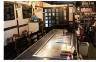
韓国料理 韓国料理 jinan

〒657-0831 神戸市灘区水道筋3丁目1番地 078-891-7077 定休日 月曜日