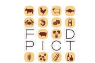
コンサルティンググループ フーズフーズ

〒657-0831 神戸市灘区水道筋3-4 (水道筋商店街 灘中央市場内) URL: https://www.whosefoods.co.jp/