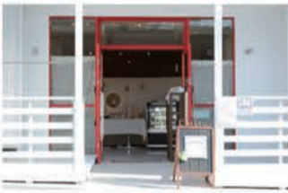
パウンドケーキ Cutiful (キュティフル)

〒657-0059 神戸市灘区篠原南町5-5-14 078-891-8810 定休日 不定休