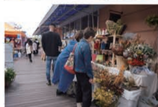
※イメージであり、実際とは異なります。