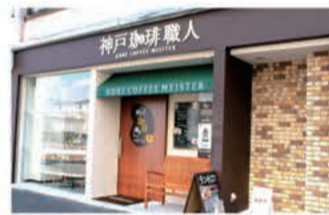
カフェ 「神戸珈琲職人」のカフェ 神戸本店

〒657-0841 神戸市灘区灘南通6丁目2-20 078-871-1189 定休日 土曜日・日曜日・祝日