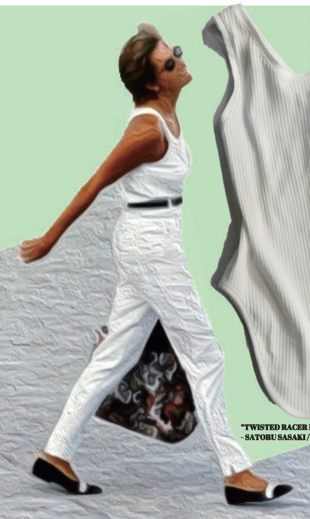
"TWISTED RACER BACK TANK" - SATORU SASAKI / 1size 2colours / 19,900-(with Tax)

Fashionable people are beautiful in simple outfits. The Prince of Wales is a style icon who has always fascinated us. Her style is wide-ranging, sometimes colourful with polka dots and checks, sometimes streetwise with college print sweat-shirts. The numerous photographs captured by the media have been an inspiration for many. Her bold colour contrasts are striking, and her simple colouring is undeniably sophisticated. The white look is refined with just-fit items, a patterned bag and black accessories, a simple yet relaxed look. When the back design is accentuated, as in the "TWISTED RACER BACK TANK" by SATORU SASAKI this season, jewellery and other accessories give a somewhat feminine impression, at least in a mannish way.