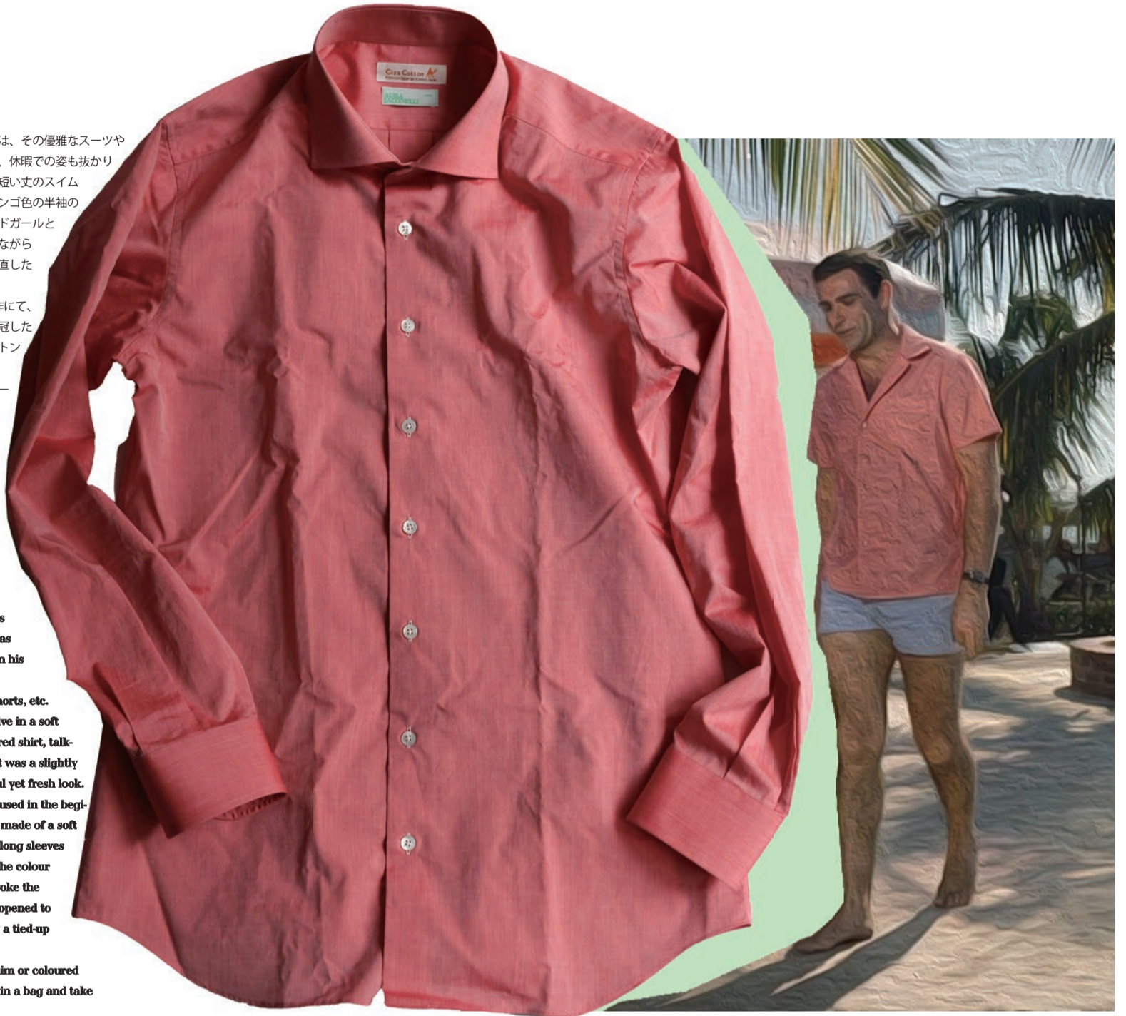
"Matera" - Anba Jaconelli / 2size 3colours / 30,900-(with Tax)

How about matching it with blue denim or coloured trousers this summer? Why not pack it in a bag and take it on a trip to the seaside?