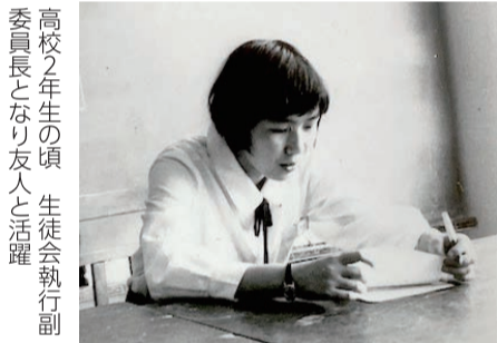
高校2年生の頃 生徒会執行副委員長となり友人と活躍

昭和38年修学旅行でバス酔いにおとなしい子だったが中学では軟式テニスで県大会女子ダブルスで優勝経験を持つ。高校ではスキーで県のインターハイに出場。高校卒業時、国立美術系大学を受験したがうまくいかずまた父の療養のこともあり共同組合に就職をした。