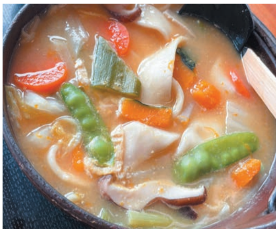
長い一本麺のほうとう