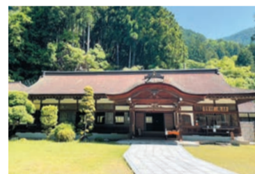
常唱殿で御朱印をいただくことができます

〒409-2524 山梨県南巨摩郡 身延町身延3628 ☎0556-62-0104(御廟法務所)