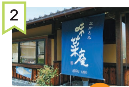
2 味菜庵 2,000円分食事券 2名

「HuMaNクッキング」でご紹介した「おざら」やほうとう、身延町特産の湯葉などの郷土料理が食べられます。