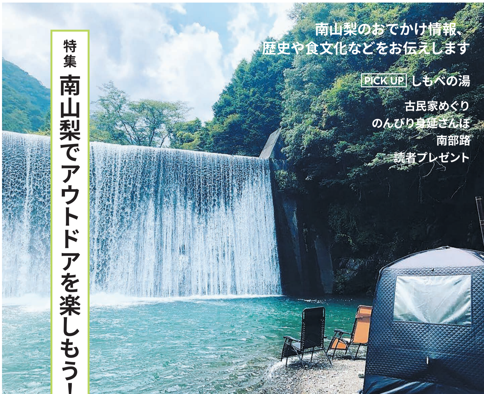
表紙写真/「山水徳間の里」滝とテントサウナ(サウナリンク提供)