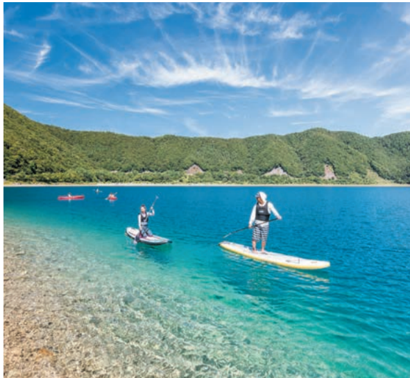
サップで水上散歩