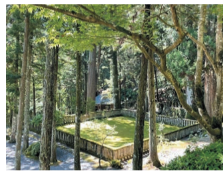
750年前に日蓮聖人が約9年間過ごした御草庵跡