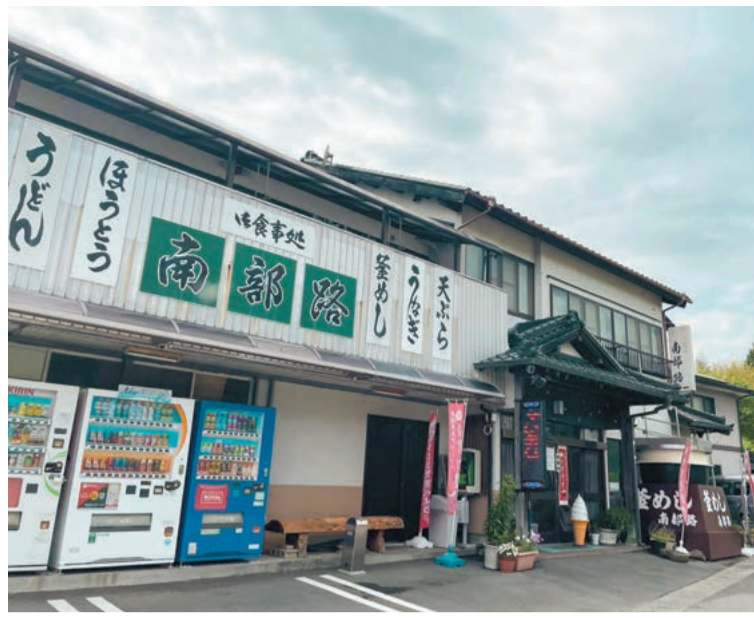
レトロな雰囲気の外観