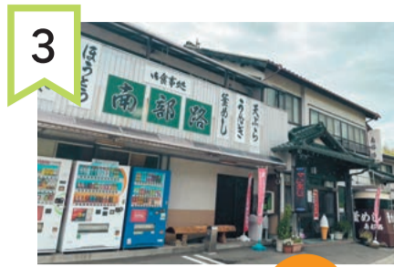
3 南部路 2,000円分食事券 2名

本文でご紹介した「南部路」。唐揚げやほうとう、釜めしの他にもたくさんメニューがあります。