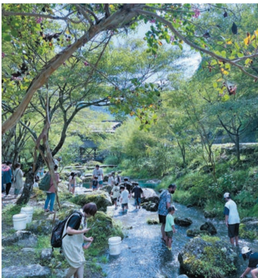
魚のつかみ取りエリア