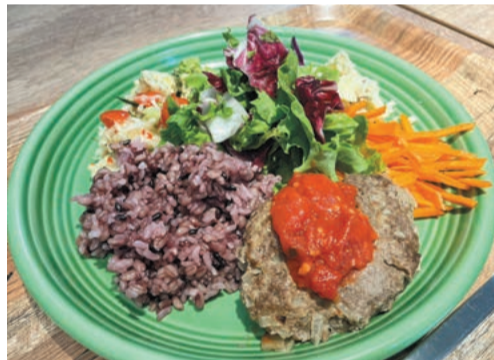
タニタカフェとコラボした3種類のヘルシープレートがある

ングができるブースの二か所に分けられていて、幅広い年齢層の人に対応。会費には施設利用料も含まれているので、トレーニングが終わったら温泉でリラックスできるのも魅力です（別途入湯税150円）。