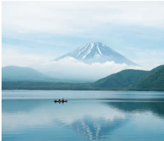
富士山を眺めながらウォーターアクティビティ