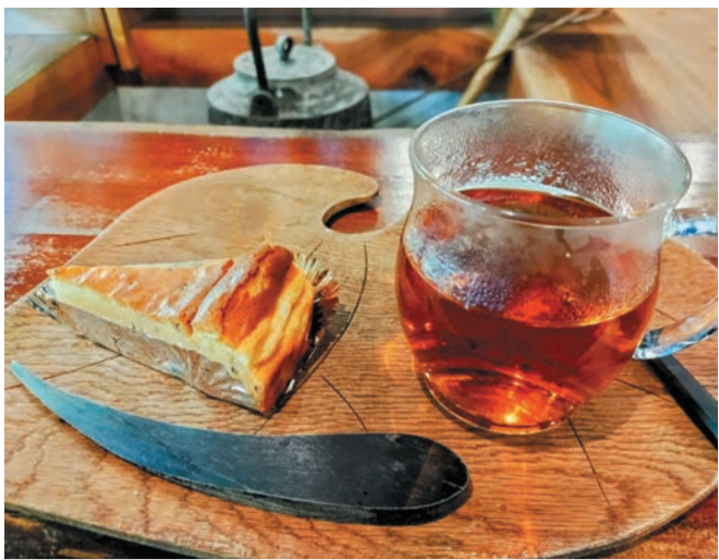
早川町産の食材を使ったケーキと紅茶