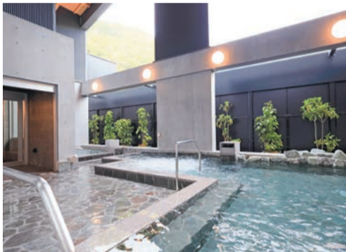
泉質の異なる2種類の源泉が楽しめる浴場内