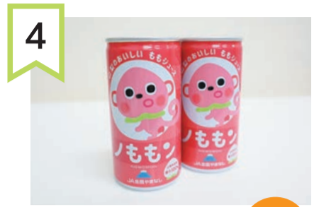
4 提供：JAグループ山梨 ももジュース「ノももん」 2名

山梨県産のおいしい桃を使った、果汁100%のジュースです。甘さひかえめ、さらりとした口あたりです。15本入り。