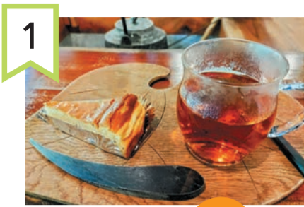
1 古民家カフェ 鍵屋 ケーキセット 2セット 2名

「古民家めぐり」の記事でご紹介した、地元産にこだわったケーキと、コーヒーや紅茶のケーキセットです。