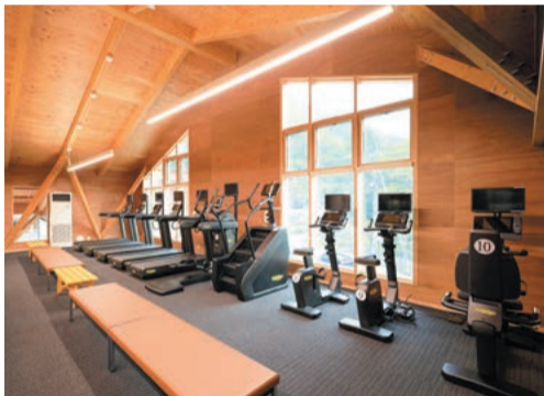
スポーツジムと、理学療法に基づいたトレーニングができる