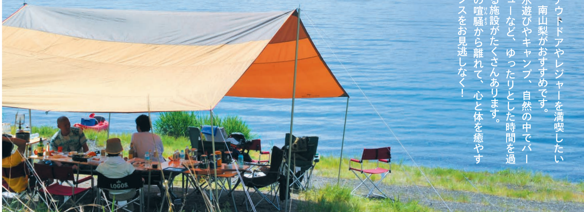
本栖湖から眺める富士山

夏のアウトドアやレジャーを満喫したいなら、南山梨がおすすめです。川で水遊びやキャンプ、自然の中でバーベキューなど、ゆったりとした時間を過ごせる施設がたくさんあります。日常の喧騒から離れて、心と体を癒やすチャンスをお見逃しなく!