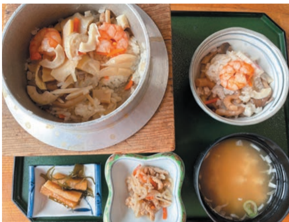
たっぷり具材の釜めし