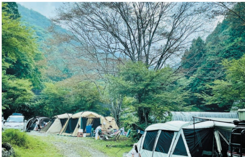
清流沿いのキャンプサイト