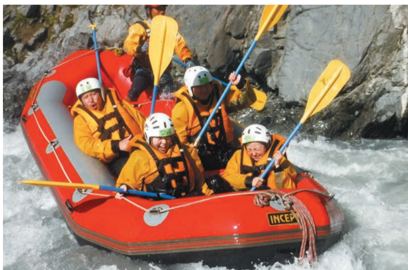
スリル満点のラフティング