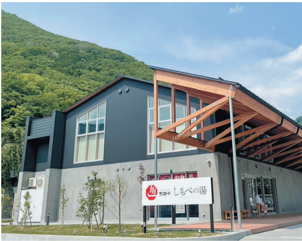
4月にオープンしたばかりの「しもべの湯」

2階には会員制のジムがあり、本格的トレーニングマシンがそろえられたブースと、高齢の方や足腰の弱っている方でも理学療法に基づいたトレーニング