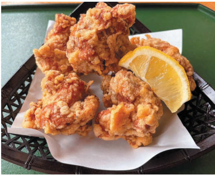
「唐揚げ弁当グランプリ」金賞を受賞