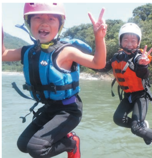
子どもも気軽に参加できます