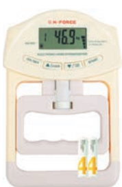
N-FORCE デジタル握力計 アイボリー オープン価格

前回測定値との比較を矢印マークでお知らせ。宅トレのモチベーションアップにGood!!