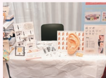
navle - ear spot jewelry - チタン粒のついたジュエリーシール