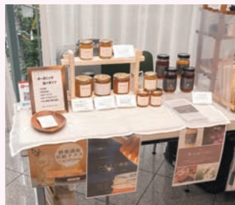
ミイミ / 生ハチミツを販売