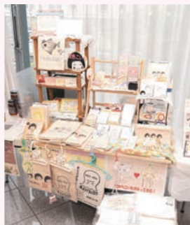
ほのぼの楽描きあーと☆空からこいもがふってきた / 雑貨物販