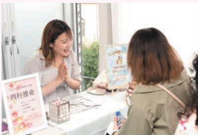
大人気の占いブースは今回3ブース出展いただきました。会場クローズギリギリまで並ばれていました。