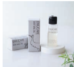
EMUCARE(エミュケア) 肌爪オイル10mL 2,970円(税込)

エミューオイルを使ったこだわりのネイルオイルが誕生。人間の皮脂成分に極めて近く、古くはアボリジニの万能薬として4万年以上も使われてきたエミューオイル。人体で生成できない必須脂肪酸オメガ3・6・9を含み、肌や爪をやさしくケアします。肌なじみが良く、べつつかず、爽やかな香りが特徴。男性にも使いやすい指先コンディショニングオイルです。