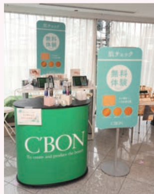
株式会社シーボン