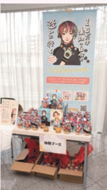
EMAJINY Hair Kolor Art Wax シャンプーでサッと洗い流せる1日だけのカラーワックス

ホール開場前・STAGE1とSTAGE2のインターバルでは、3F展示場でお楽しみいただき、STAGE1 終了後からはアルコールドリンクの提供も。