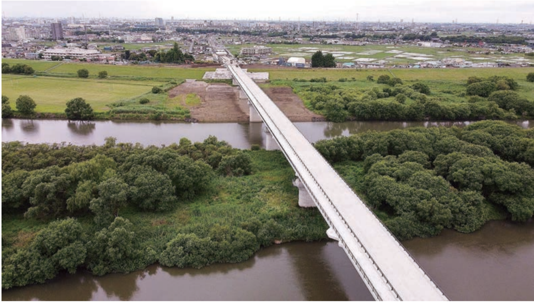
埼玉県側を望む三郷流山橋のドローン画像