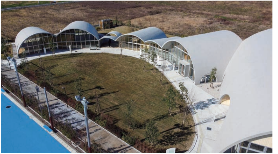
高元・ムサシ特定建設工事共同企業体が竣工したmiraton