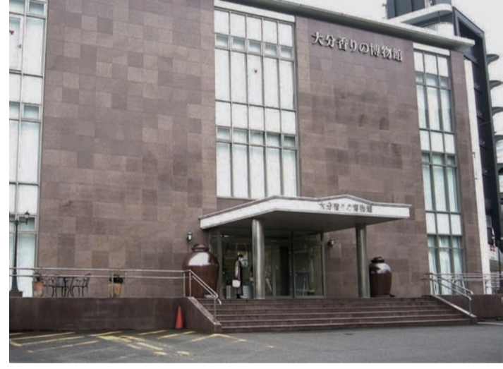
世界で一つしかない自分だけの香水が持ち帰られる「大分香りの博物館」

もともとは県が大分市内に、「大分香りの森博物館」という名称で開設していたが、行財政改革の一環から2006年に閉館。貴重な展示品や資料が散逸してしまう危機に直面したのだが、それを防いだのが別府