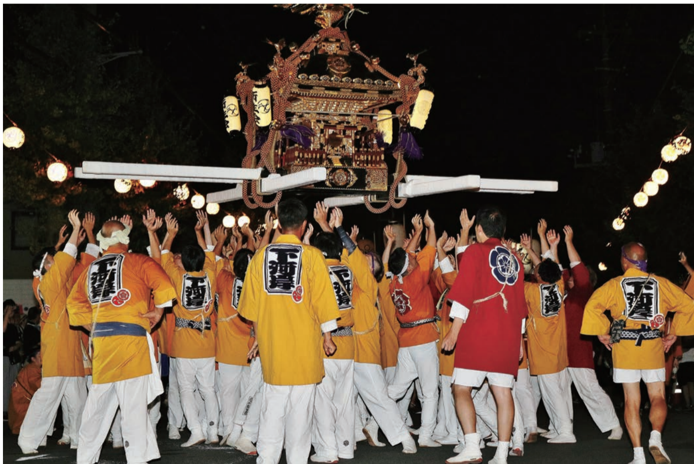
神輿が宙に舞うたびに、沿道を埋めた観客から大きな歓声が沸く＝吉川市いちょう通りで。

木落し西側道路では、祭りの華「露店」がズラリと出店。が、余りの人出の多さに主催側の指示で早めの閉店。「売り上げ減だ」とぼやく露天商も。