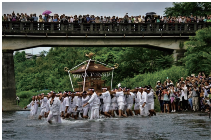
見物客が見守る中、荒川に担ぎ込まれる白木の大神輿。コロナ前撮影。

の声に合わせて大神輿は荒川に担ぎ込まれた。増水気味の流れに逆らい、足を取られながらも神輿に水をかけて厄払い。河原に設けられた斎場に担ぎ上げ無病息災を願った。秩父盆地は夏本番。県東部に負けない酷暑が続く毎日。