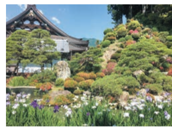
美しい「水鳴楼前庭」もぜひ観覧してほしい

〒409-2593 山梨県南巨摩郡 身延町身延3567 ☎0556-62-1011