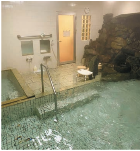
ぬる湯で知られる下部温泉での長湯は最高だ