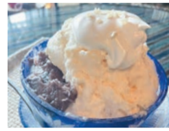
通年提供予定の酒粕かき氷も絶品。写真はハーフサイズ

かつて油の販売が生業だったというこの家と出会い、導かれるようにして今に至ります。