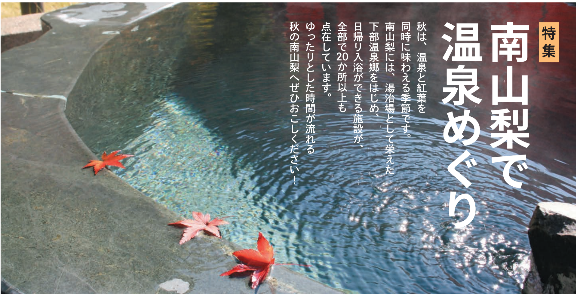
早川町「湯島の湯」の露天風呂

秋は、温泉と紅葉を同時に味わえる季節です。南山梨には、湯治場として栄えた下部温泉郷をはじめ、日帰り入浴ができる施設が、全部で20か所以上も点在しています。ゆったりとした時間が流れる秋の南山梨へぜひおこしくください！