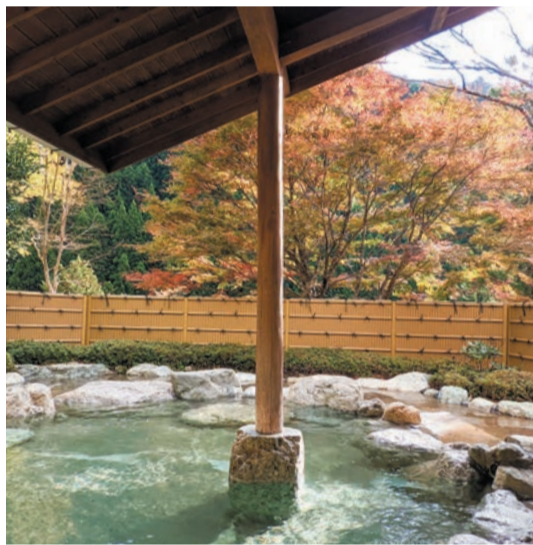
露天風呂から紅葉を楽しむ