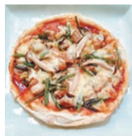
おすすめの奥山温泉ピザ(900円)