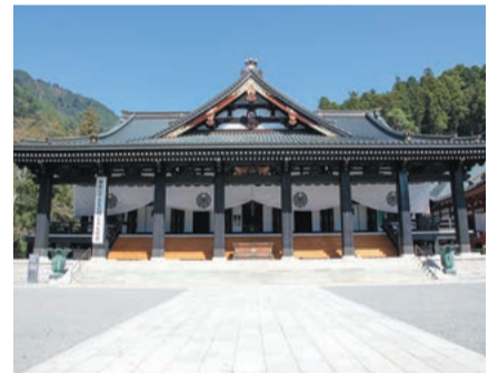
久遠寺の「大本堂」は1500人が入れるという広さを誇る