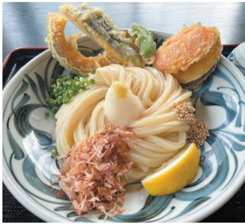
野菜天うどん。見た目も美しく、食欲をそそる

ことし、7月12日に道の駅しもべにオープンした「笑里」では、国産素材を使った天然だしのきいたつゆが特徴のうどんを堪能できます。