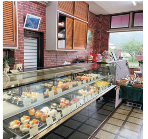
たくさんのケーキが並ぶ店内。焼き菓子も豊富だ