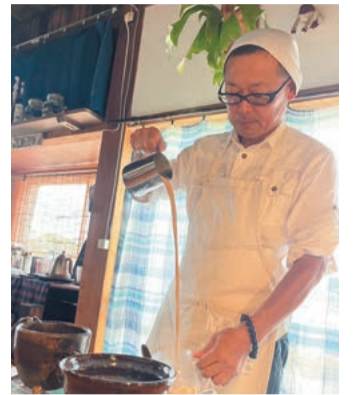
目の前でいれてくれるチャイは、好みの味に調整してもらえる

かつて油の販売が生業だったというこの家と出会い、導かれるようにして今に至ります。