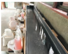
洗い場でも源泉を利用。温泉で十分に体を洗える