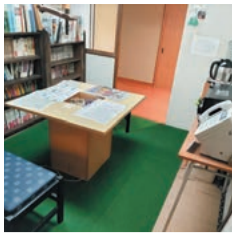
レトロな雰囲気のある休憩所