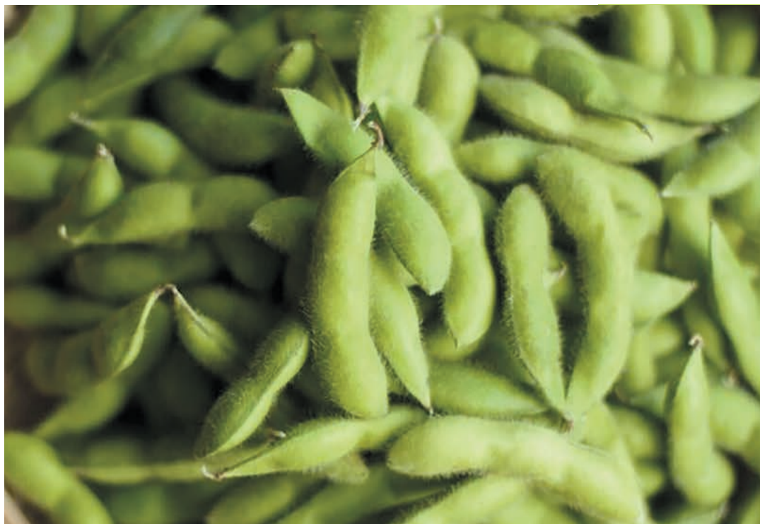
10月に枝豆の収穫、11月下旬～12月中旬に大豆の収穫と、極晩生種のあけぼの大豆。そのぶん時間をかけて成長するため、強い甘みと深みのある味に