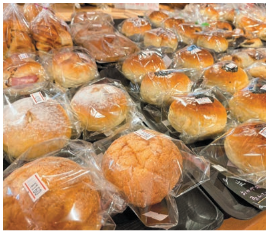
売り切れることも多いので、販売時間に行くのがおすすめ

貴美ちゃんパン 〒409-2732 山梨県南巨摩郡 早川町高住650-1 チャレンジキッチン (南アルプスプラザ隣) ☎0556-48-8632 アクセス／中部横断自動車道 下部温泉・早川IC より約25分