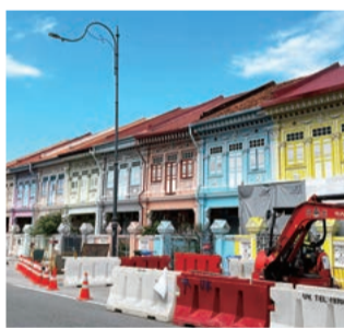
Katongエリアのプラナカンデザインショップハウスたち