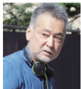
瀬々 敬久 映画監督