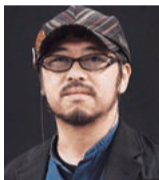
清水 崇 映画監督