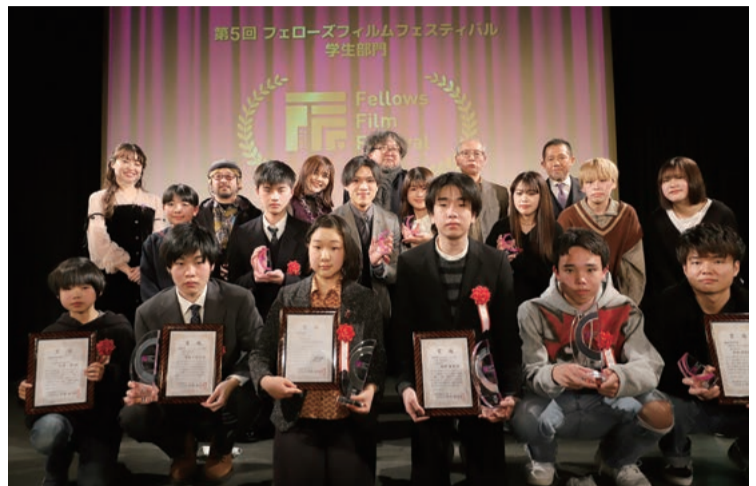
主催：株式会社フェローズ(FFF-S事務局)