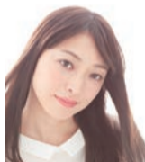
広山 詞葉 映画プロデューサー /女優