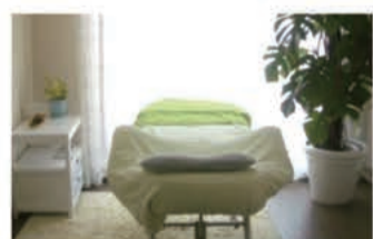
サロン メイクアップSiesta (シエスタ)