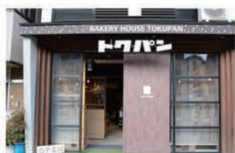
パン BAKERY HOUSE TOKUPAN

〒657-0846 神戸市灘区岩屋北町2丁目4-6 070-7489-3313 定休日 日曜日・不定休