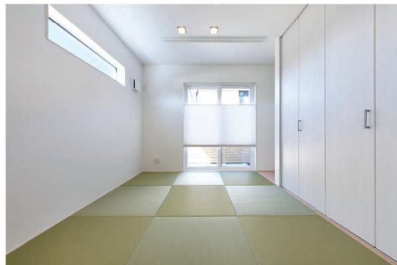
ホワイトでまとめられた空間に和量の緑がよく映えます

A5. 最初に完成した自宅を見たときの正直な感想は「でっかっ！」でした（笑）。もちろん私たちも設計図などで大まかな完成イメージを把握していたつもりでしたが、実際に実物を目の当たりにすると「このスペースにこんな大きな建物が建つなんて…」という驚きが強かったですね。