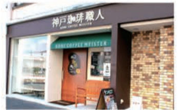
カフェ 「神戸珈琲職人」のカフェ 神戸本店

〒657-0841 神戸市灘区灘南通6丁目2-20 078-871-1189 定休日 土曜日・日曜日・祝日