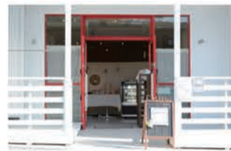
パウンドケーキ Cutiful (キューティフル)

〒657-0059 神戸市灘区篠原南町5-5-14 078-891-8810 定休日 不定休