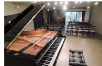
スタジオ 音楽ホール&ギャラリー「里夢」

〒657-0063 神戸市灘区曾和町1-4-2-B1 電話：078-821-2140 定休日 12月31日、1月1日、2日