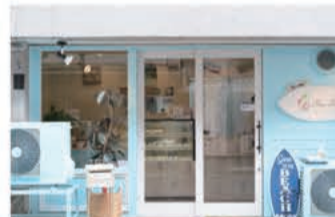
ケーキ 小さな菓子専門店 ファリリィ

〒657-0035 神戸市灘区友田町4丁目1-23 078-806-8242 定休日 不定休