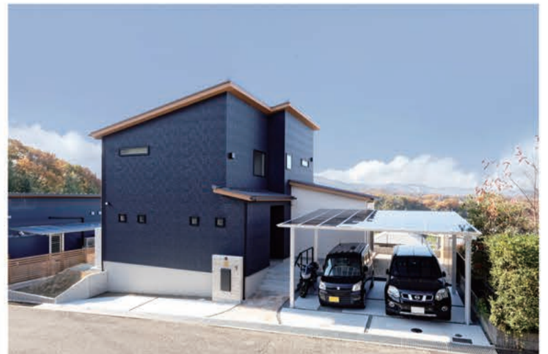
自然が豊かで静かな高台にご夫婦のこだわりが詰まった家が完成しました

A10. 家を建てるから決めてから私たちがそれぞれに勉強をしたつもりですが、実際の施工が始まってからは想像していなかったことや考えが及ばなかったことがたくさんあったことに気づかされました。やはり餅は餅屋ではないですが、経験豊富な方にアドバイスを求めるのが一番大切ではないかと思えます。幸いあんじゅホームには知識や経験が豊富なスタッフさんが揃っていますので、打ち合わせのときに自分たちの気持ちや要望をしっかりと伝えておけば、当初のイメージに近い家ができると思えます。ぜひ理想の家をあんじゅホームのスタッフさんと一緒に作っていただきたいですね。