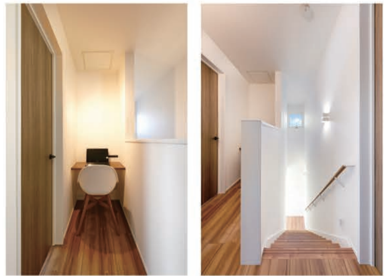
階段脇のデッドスペースも作業スペースとして有効活用しています

A8. 私が気に入っている場所はアイランドキッチンですね。この家を建てる少し前に弟夫婦が実家の建て替えをしてキッチンがアイランドにしたのですが、家事の動線がシンプルになって使いやすかったと聞きました。その時、「私も家を建てる時は絶対にキッチンはアイランドにしよう」と強く思ったことを覚えています。また、夫は玄関がお気に入りの場所だと言っています。この家は基本的に私の意見が尊重されているのですが、玄関だけは主人の意見を丸々採用して作っていただきました。今でも家に帰ってくるたびに「いい玄関だなあ」と思っているそうですよ。