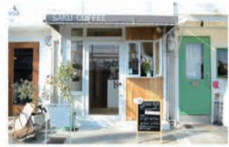
カフェ 朔コーヒー