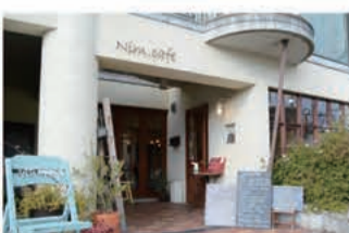
カフェ Nim.cafe (ニムカフェ)

〒657-0825 神戸市灘区中原通6丁目1-15 078-806-3707 定休日 火曜日