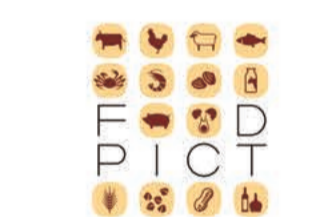
コンサルティンググループ フーズフーズ