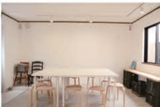
コミュニティスペース kiten