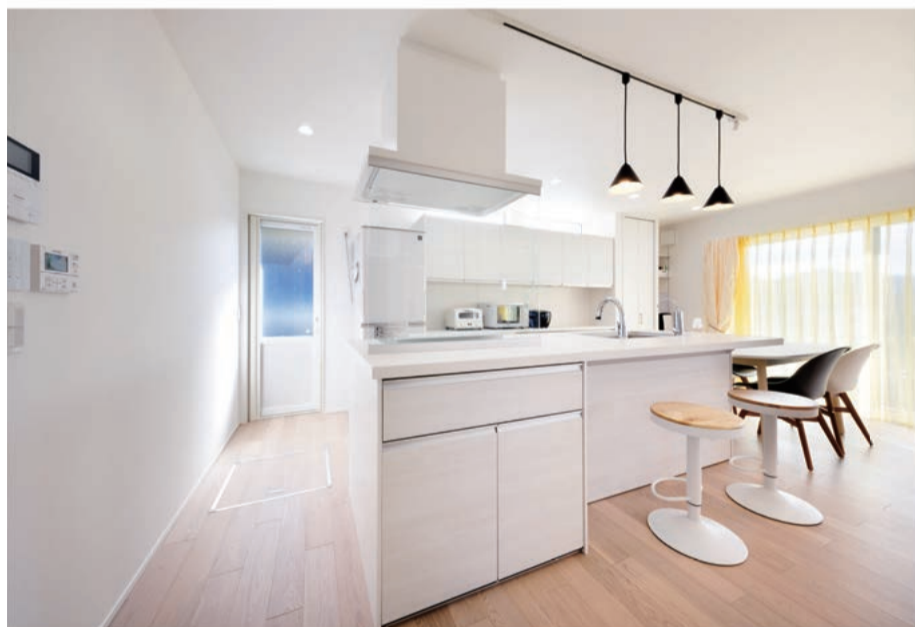
キッチンアイランド型にしたおかげで動きやすい動線になったそうです