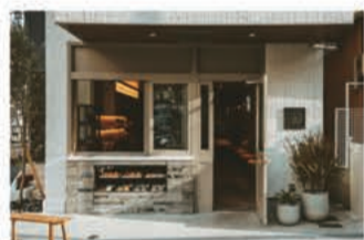
カフェ CHARMANT Cafe & COFFEE ROASTERY