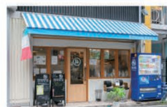
イタリアン Pizzeria RICCA

〒657-0838 神戸市灘区王子町1丁目3-23 レインボープラザ102 078-262-1292 定休日 水曜日・火曜日ディナータイムのみ