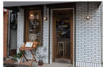
ワイン IN VIAGGIO (インヴィアッジョ)

〒657-0836 神戸市灘区城内通5丁目2-4 078-223-3689 定休日 不定休