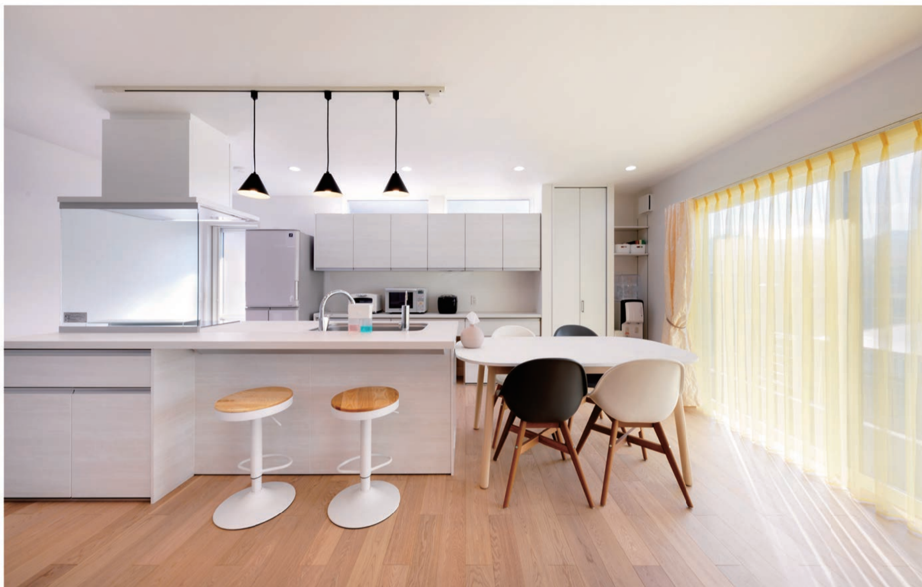
とにかく明るい家になるように、リビングには外光を十分に取り込める大きな窓を南側に設置しました