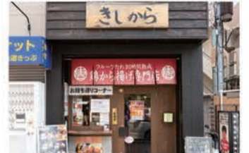
からあげ きしから 灘・岩屋店

〒657-0846 神戸市灘区岩屋北町4-3-10 1F 078-806-3550 定休日 不定休