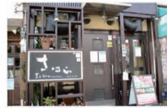
焼肉 黒毛和牛焼肉 さはら

〒657-0821 神戸市灘区赤坂通5丁目3-11 078-802-8929 定休日 月曜日 (月曜日が祝日の場合は火曜日休み)