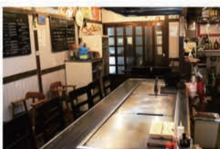
韓国料理 韓国料理 jinan

〒657-0831 神戸市灘区水道筋3丁目1番地 078-891-7077 定休日 月曜日