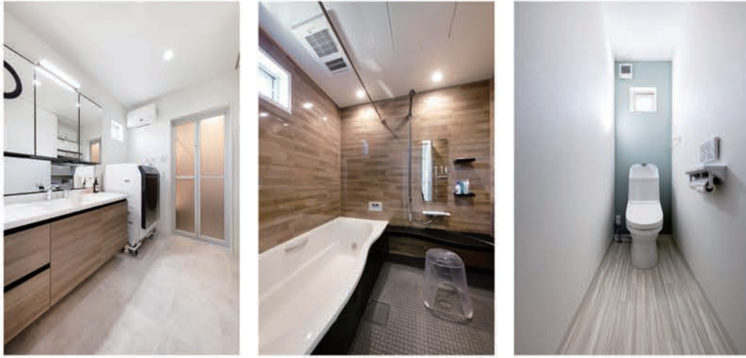
奥さまのこだわりで木目調が効果的に使用されています