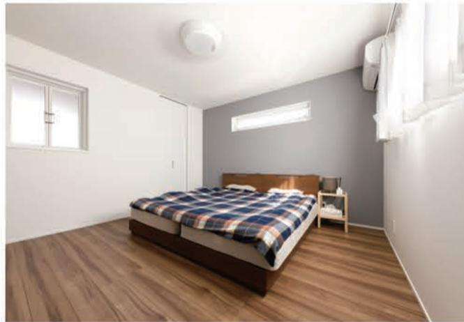
寝室などのプライベートスペースは飽きが来ないようにあえてシンプルにしました