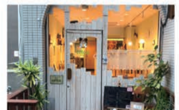
カフェ Teacafe Colour

〒657-0838 神戸市灘区王子町1丁目2-21 サンビルダー王子公園101 078-882-6010 定休日 木曜日