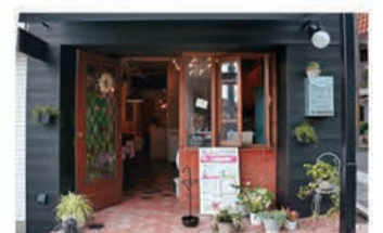
ガレット・クレープ LE MARRON (ルマロン)

〒657-0064 神戸市灘区山田町2丁目1-12 078-855-4317 定休日 日曜日