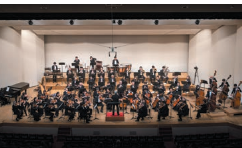
第62回定期演奏会の演奏風景

例えば仕事で疲れていたり、落ち込んだりしていても足はそこへ向かう。音楽が心を満たしてくれる。