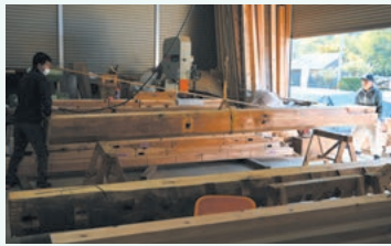
発酵素材®暮らしの道具店 営業日 金・土・日 10:00~18:00