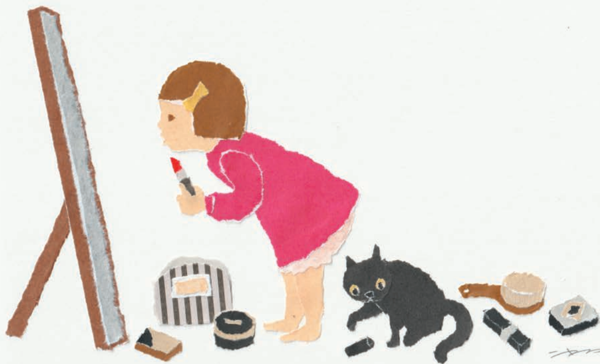
※12/14(木)までpage cafe(ブックユニオンたかはた内)にて「猫まみれ展II」(グループ展)開催中。

昔ながらの杵つき餅は、コシと粘りが違います。切り餅・水餅のご予約開始！ 12/15 まで 2,900円以上のご予約で特製あんこ(500円分)をプレゼント。