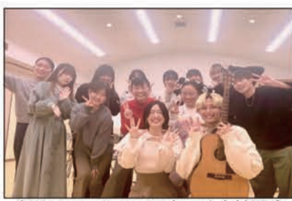
↑Charmant cocoのお二人と練習会