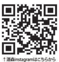
↑酒森instagramはこちらから