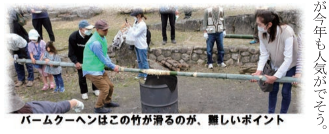
バームクーヘンはこの竹が滑るのが、難しいポイント

ゆるく、まったりと交野の人と人のつながりを感じながら一日のんびりと環境を感じることが出来る交野の環境フェスタが今年も星の里いわふねで開催される。出展者、関係者が毎年の人々のつながりの中での新たな出会いに期待をして、準備が整ってきた。 環境フェスタin交野2024は、例年どおり星の里いわふねで3月10日(日)に開催される。主催のかたの環境フェスタ市民会議は同じ気持ちで運営されている。