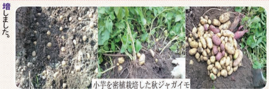
小芋を密植栽培した秋ジャガイモ

物足りない感覚が生まれ、この冬からイモ類など掘って収穫する作物の後は掘るようになり、また、ダイコンなどはこの後に作付けするようにします。作付け計画が少しこれまでは変わりますが、これも頭の体操です。気候の変動も大きく害虫の発生動向も変わってきています。トウモロコシはこれまでアワノメイガの発生前を狙って3月上旬に種まきして6月中旬に収穫していましたが、昨年はこれでも一部が被害されました。今年は2月下旬に播いてみます。種を植えたら不織布とビニールをべた掛けして、発芽したらトンネルにします。さらに早生種にすれば5月中旬に収穫できるようになるのですが、後作はサツマイモの予定で慌てることもないので、中晩生種にします。トウモロコシが肥料分を使い切ってくれ、とイモの栽培に好都合です。サツマイモの苗作りの伏せ込みも3月上旬に、同じように保温して始めます。私は芋の上下がよく判らないので、横向きで半分埋めて発芽させています。お気に入りのイモが手に入ったら、イチゴなどのマルチの下に埋めておいても忘れたころに発芽して苗取りができます。スーパードライヤーなどの処理が面倒なのと、時間もかからなくなりました。