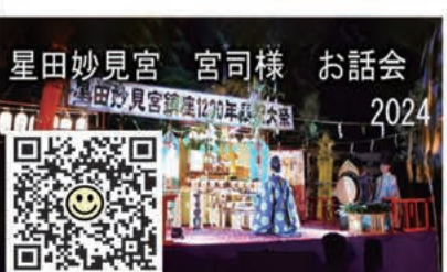
星田妙見宮 宮司様 お話し会 2024

星田山手地区はまだまだ紹介しきれない活動があり、ほんとうにいろいろな人材に恵まれているそんな頼もしい地域です。