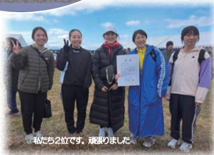
私たち2位です。頑張りました。

このコーナーなんという話でもないけど、『むふふ』と笑ってしまうコラムをお届けします。