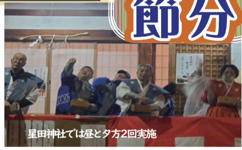
星田神社では昼と夕方2回実施

2月3日（土）は節分。市内の各神社で例祭のち、豆まき神事が執り行われた。とりわけ私部住吉神社は19時から3回、星田神社では15時と18時の2回、設置された舞台上の来賓や厄年の市民が落花生や豆袋を集めた市民にまき、鬼は外の掛け声が境内に響き渡った。 大人も子どもこの縁起物の豆をたくさん受け取り、用意した袋に入れて持った。 2月4日（日）には、星若寺でも福豆まきが実施され、先着で巻き寿司と紅白の餅が配られた。