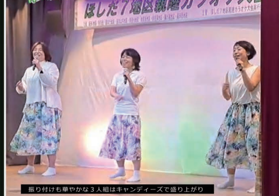
振り付けも華やかな3人組はキャンディーズで盛り上がり