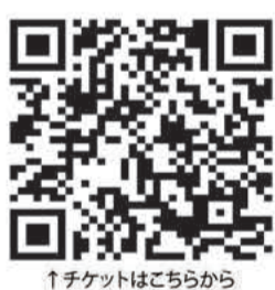
↑チケットはこちらから