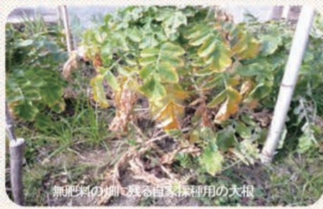
無肥料の畑に残る自家採種用の大根

2月後半からは野菜栽培が本格的に始まります。1m近く毎回深く掘っていた耕作法から不耕栽培に変えて2年間、耕作法が変わって変わったのは作物では二股ダイコンが増えたことぐらいでした。体は楽になりましたが、時間もかからなくなりましたが、残渣(ごみ)の処理が面倒なのと、時間もかからなくなりました。スーパードライヤーなどの処理が面倒なのと、時間もかからなくなりました。