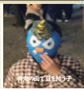
青鬼の面で豆を拾う子