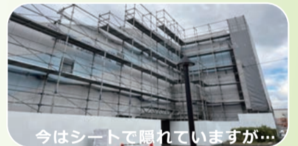
今はシートで隠れていますが...

建物の色合いが思いきって黄色とか赤色とかそういうのにはならないと思いますが、どんな感じになっていくのか気になるところです。