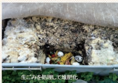
生ごみを処理して堆肥化

かぼちゃクラブは有機無農薬でさえあれば農法は問わないので、草もなくきれいな人もいれば、草だらけの畑で作業する人もいます。肥料も鶏糞や油粕を使う人もいますが、多くの人が堆肥をメインにして中和はもみ殻燐炭や牡蠣殻を使い、完全無肥料を貫く人も3人ほどいます。私は自宅の生ごみをJAの精米所で手に入れた米ぬかで発酵させて生ごみ堆肥を作っています。これをメインに使っています。肥料分は窒素、リン酸が2%程度、カリは1%程度と聞いています。生ごみには毎日2〜3個の卵の殻が入るので年間分では6kg程度の炭酸カルシウムも入った完全肥料と思っています。