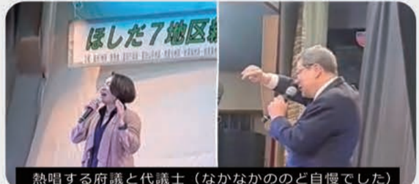
熱唱する府議と代議士(なかなかののど自慢でした)

たこのイベントは今年で19回目となります。カラオケにエントリーした参加者は約80名、実行委員でもある7名の区長も全員歌声を披露したという熱の入れよう。ドレスや着物姿で熱唱する参加者も多く、拍手やかけ声・花束贈呈など会場は大いに盛り上がりていました。