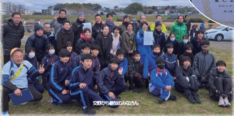
交野から参加のみなさん

第73回北河内地区駅伝競争大会（北河内体育振興会、北河内7市、各市教育委員会主催）が、2月4日（日）、立春の枚方市の淀川河川公園で開催されました。 前日からの雨も朝には上がり、参加した全31チームがタスキをつないで河川敷の周回コースを駆け抜けました。 交野市からは一般部（男子A・B・C、女子中学生の部（男子A・B・C、女子A・B））の9チームがエントリー、それぞれ全力で走って頑張った結果、一般女子が2位、一般男子Aチームが3位と表彰されました。