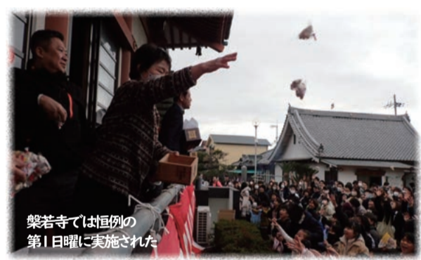
星若寺では恒例の第1日曜日に実施された

2月3日（土）は節分。市内の各神社で例祭のち、豆まき神事が執り行われた。とりわけ私部住吉神社は19時から3回、星田神社では15時と18時の2回、設置された舞台上の来賓や厄年の市民が落花生や豆袋を集めた市民にまき、鬼は外の掛け声が境内に響き渡った。 大人も子どもこの縁起物の豆をたくさん受け取り、用意した袋に入れて持った。 2月4日（日）には、星若寺でも福豆まきが実施され、先着で巻き寿司と紅白の餅が配られた。