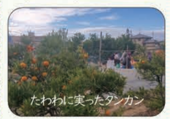
たわわに実ったタンカン

ゴールと呼ばれるみかんとオレンジの交雑種の一つで分厚い皮の下にフルーティーで甘いオレンジの実がついています。家族で収穫体験し、皮をお土産に楽しみ、笑顔でお土産を手提げ袋両手に抱えきれないほど持ち帰る人が多く、1時間半でほぼすべての実が収穫されました。同好会の世話役は早速、剪定などの計画を話し合っていました。