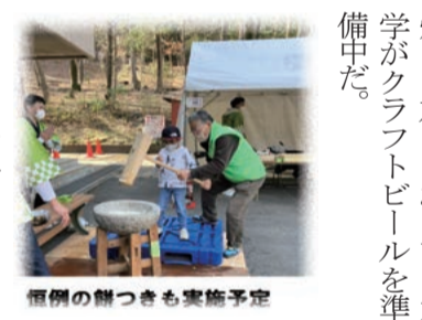
恒例の餅つきも実施予定

野外の水辺プラザでは今年も木の年輪焼き《バームクーヘン》を実施。第1駐車場では献血や各種頒布の出店があり、交野産野菜、竹炭、たこやきなどの販売が賑わう。 グリーンビレッジ南側では今年も餅つきが盛大に実施され、その側では餃子、チャンポン、イカ焼きに加え、おりひめ大がクラフトビールを準備中だ。