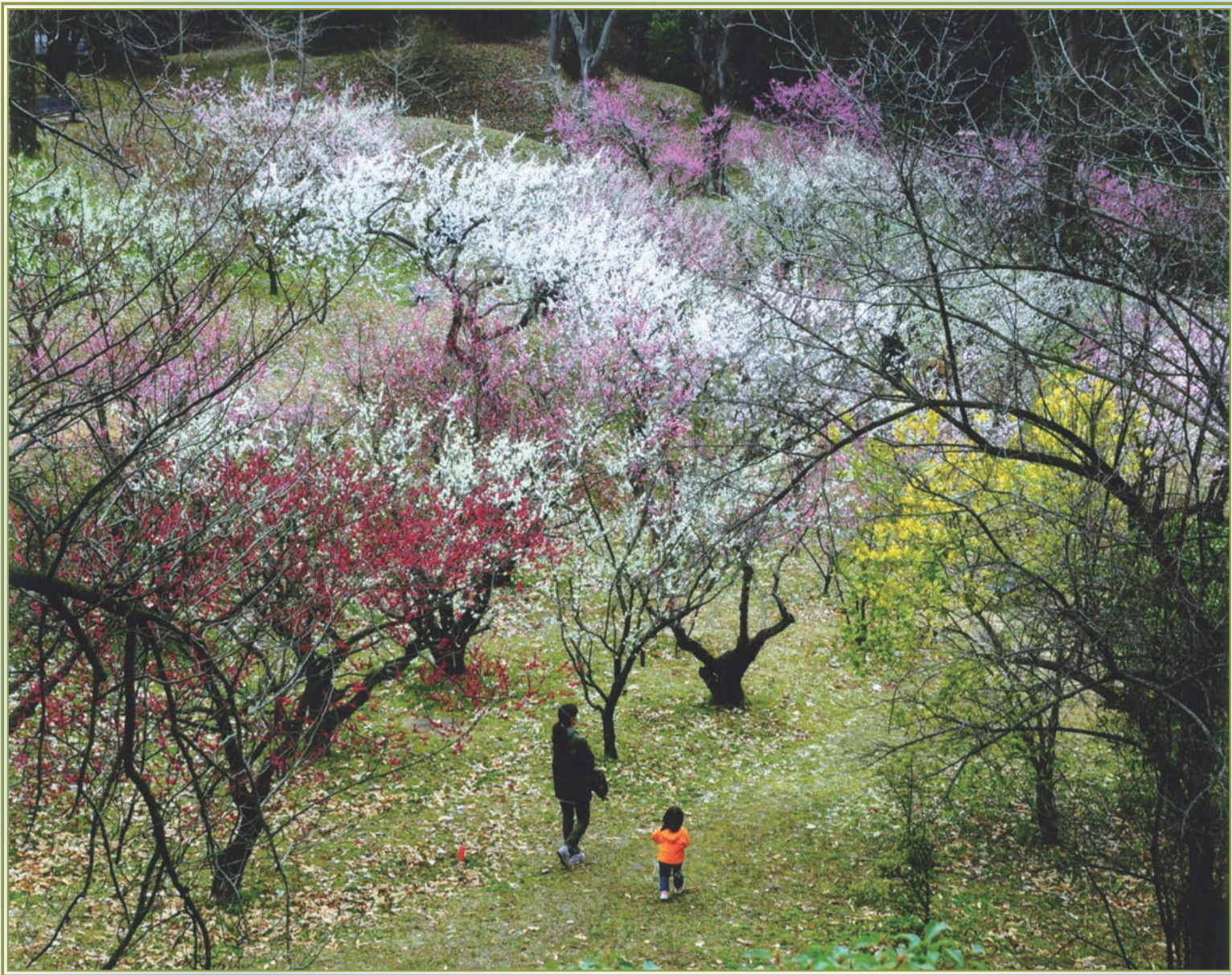
【植物園の梅林を散歩】 勝野(2021 応募)