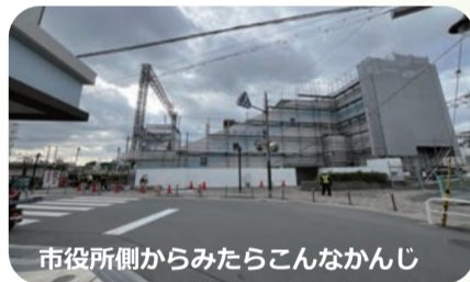
市役所側からみたらこんなかんじ

一部はグレーの工事用のシートが張られていて、青年の家や市役所方面入り口のところ側は足場がむき出しの状態でした。