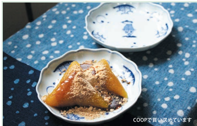
COOPで買い求めています

庄内地方の黄色いぶるんとした求肥のような笹巻が大好きです。ひな祭りの時期から端午の節句の5月初めまで買い求めることができます。