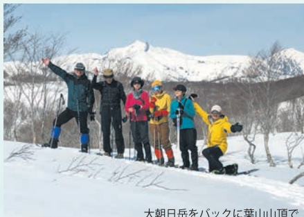
大朝日岳をバックに葉山山頂で

長井の葉山では、雪解け前線が登山口から次第に上ってゆくにつれ、「春の使者」という花言葉をもつイワウチワの淡いピンク色の花が咲き乱れるようになります。そし