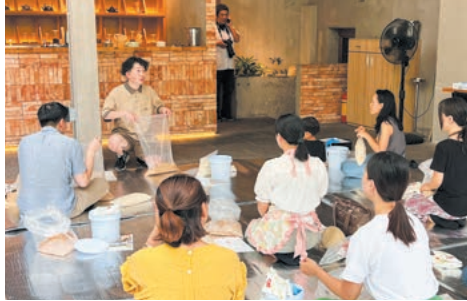
今年2月のベトナムでの味噌作りワークショップ