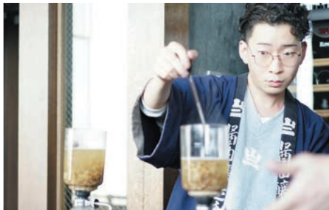
サイフォン味噌汁を作る様子

幼い頃から学んでいた英語のスキルを高めたのと、英語科のある県外の高校に寮生活をしながら通った。卒業後は、演劇を学ぶためにアメリカの大学へ入学した。