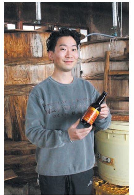
3/10に発売した味噌ビールを手