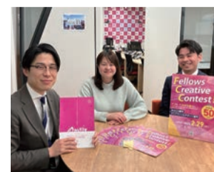
Fellows Creative Contest 実行委員会メンバー

自社の社内外に対するブランディングにお困りの方は、こういったコンテストの開催などに、ぜひ挑戦してみてください。