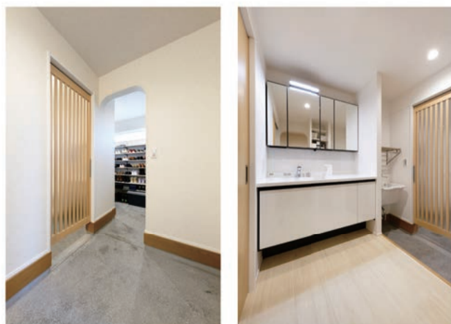
海外生活で日本の良さを再確認したことで、ご自宅には和モダンテイストを随所に取り入れました