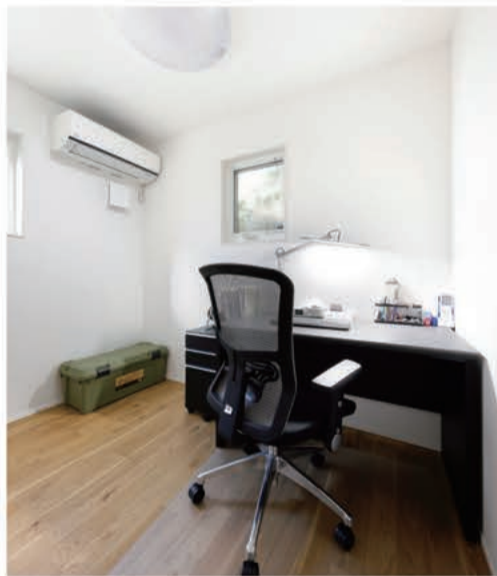
仕事柄、海外とのやりとりが多いご主人さまのために設けられた書斎兼仕事部屋