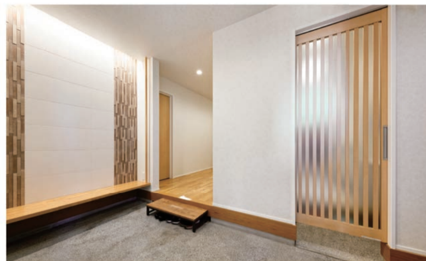
雨の日でもおさまが思い切り遊べるように、玄関スペースはあえて広く取りました

A3. 最初は大手ハウスメーカーをお願いするつもりで相談を進めていたのですが、そのハウスメーカーでは基本の間取りが大枠で決まっており、細かなこだわりの部分についてはオプションを追加していくというかたちでした。私たちは家に対するこだわりが多かったこともあり、家づくりの自由度が低いことや費用面で割高になってしまうことに不満を感じていました。しかし、並行して相談を進めていたあんじゅホームでは間取りや内装を自分たちで自由に決めることができ、追加料金となるオプションの部分についても私たちにとって必要か不要かをしっかり具体的に説明してくれたこともあって、あんじゅホームにお任せしたほうが納得できる家づくりができると思ってお任せすることにしました。