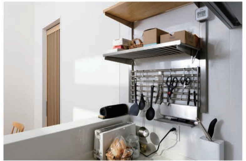
整理収納アドバイザーのアドバイスで調理用品は使いやすいように一箇所にまとめました

A8. もちろんリビングもお気に入りの場所ですが、同じくらい私はL字型のキッチン気に入っています。最初はキッチンにL字型にすることでデッドスペースが生まれるのではないかと心配していましたが、あんじゅホームで整理収納アドバイザーの資格をもつスタッフさんのアドバイスが納得できるものであったため、最終的にはL字型のキッチンを設置していただきました。結果として使い勝手も非常に良かったので、スタッフさんのアドバイス通りにしてよかったと思っています。