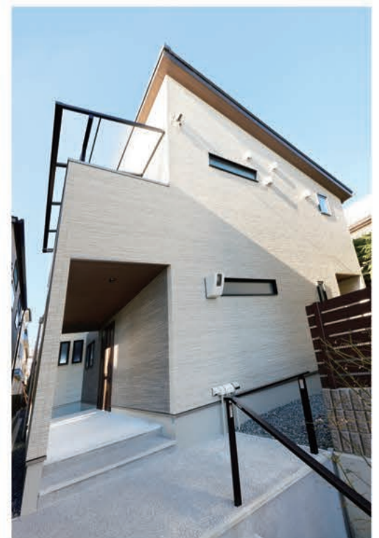
南側から太陽の光が降り注ぐ、明るい建物になりました

A9. 夫は分譲マンションに住んでいたときにはなかった書斎兼仕事部屋気に入っているようです。仕事柄、時差のある海外とのやりとりが多いこともあって、自宅では私と子どもに気を遣いながら仕事をしている部分もあったようですが、仕事部屋ができてからは安心して海外とのやり取りができるようになったと喜んでます。