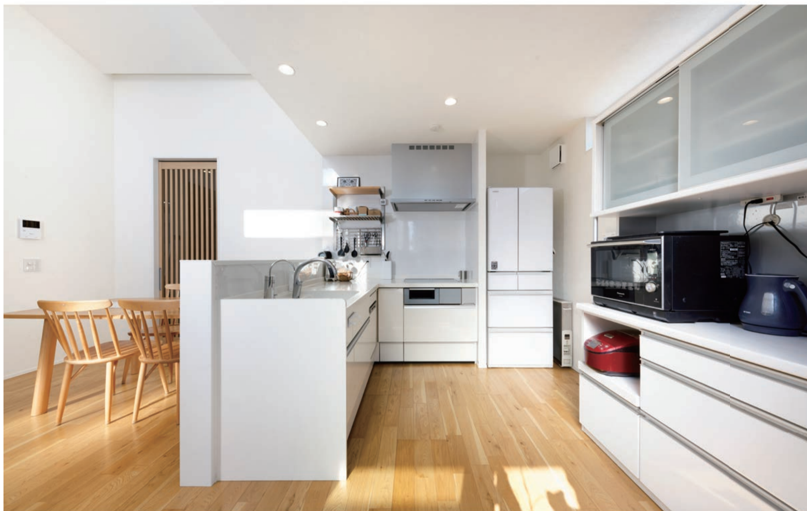
奥さまこだわりのL字型キッチン。奥さまはキッチンから見える景色がお気に入り