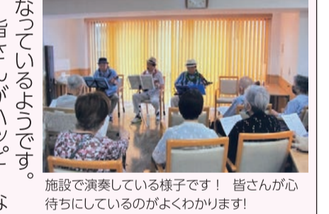
施設で演奏している様子です! 皆さんが心待ちにしているのがよくわかります!

前に結成してから、地区センター、コミュニティハウス、ケアプラザ、介護施設等で活動を重ね、昨年は10回のコンサートを開催。皆さんに憩いや癒しをお届けし喜んで頂くことで、逆に元気を頂いているとのこと。先日もデイサービス