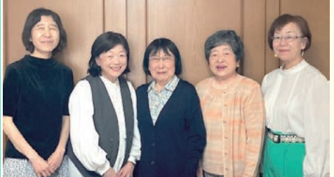
ビオリラレインボーさんの皆さんです! 練習中は笑い声がいっぱいでした!

演奏先で高齢者が「懐かしい懐かしい」と話しかけてくださったたり、「学生時代に先生がよく歌ってくれた歌をきかせてもらってとてもうれしい」と「故郷の歌を聴くことができて感激した」と言われ感動することも多いそう。