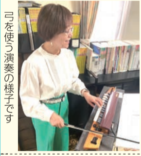
弓を使う演奏の様子です

ヴィオリラレインボウは2004年から続いているヴィオリラの演奏グループ。20年以上前にヤマハのエレクトーン指導者の集まりで弓を用いて弾く新しい大正琴を紹介されたのをきっかけに始まりました。皆さん大正琴とヴィオリラの指導者でもありません。