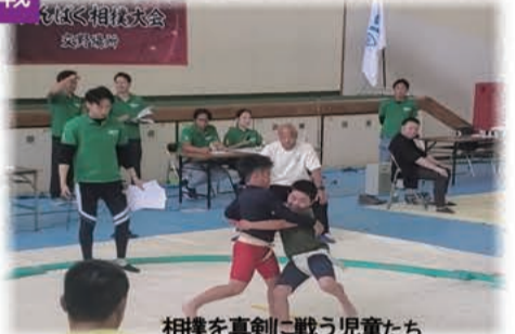
相撲を真剣に戦う児童たち