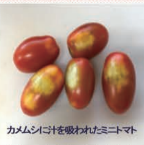
カメシシの汁を吸われたミニトマト