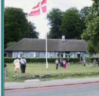
↑知の欲求を満たす場、フォルケホイスコーレ

デンマークのフォルケホイスコーレは、入学試験がなく、17歳と6か月以上ならだれでも入学でき、成績がつかなくても、資格を取ることもできません。では何のために何を学ぶところなのかというと、70校ほどあるフォルケホイスコーレのすべてが、「個人が単に生計を立てるだけでなく、人生を生きることを可能にする教育」という目的を掲げ、自分の幸せや関心に基づいて、とことん好きなことを学ぶことができる教育機関です。