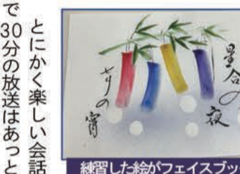
練習した絵がフェイスブックに

「日めくりカレンダー文子」を1000部作りました。内容は自分の言葉もあり、感動した人の言葉もあつて31枚すべてに挿絵を描いています。また少しでも知ってもらえたらいいなあという顔なじみになつたお店をSNSで紹介しまくります。