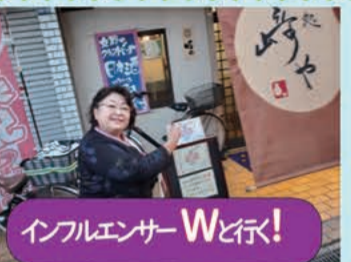
インフルエンサーWと行く!

下記のQRから見てRもわかりますが、SNSに1日平均15回アップしているというから驚異的です。