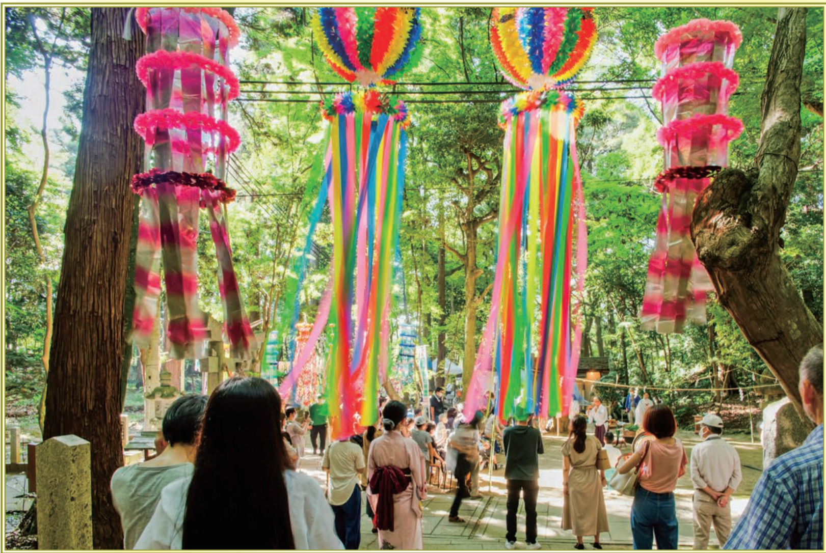
【星田妙見・七夕祭り】 大谷(2022 応募)