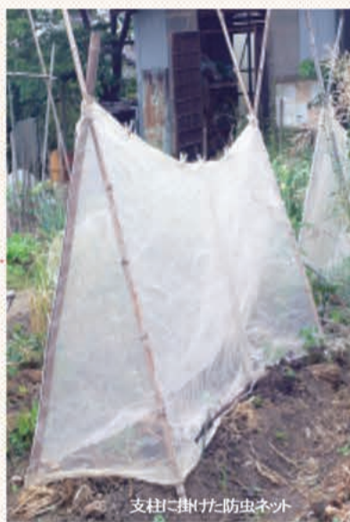
支柱に掛けた防虫ネット

合わせて考察すると生育中に過湿になったかどうかが分かる道と思われま。カラカラになつた畑にバケツをひっくり返したような雨が降るといった