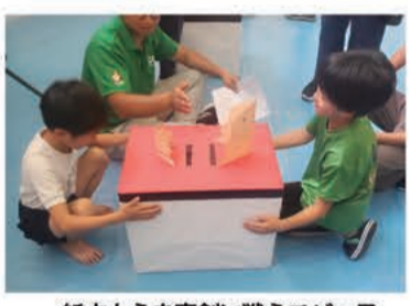
紙すもうを真剣に戦うチビっこ。

最初は紙力士の制作に戸惑っていた子どもたちも、時間がたつにつれ折り紙の工夫を重ね、土俵の段ボールをたたいて揺らしてもなかなか倒れない秀作が目見え。