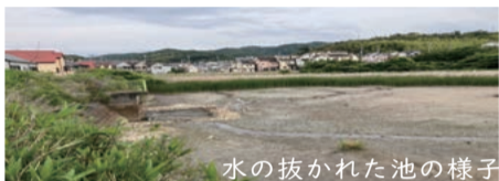
水の抜かれた池の様子