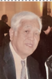
2011年 ステップイン銀の会での1枚