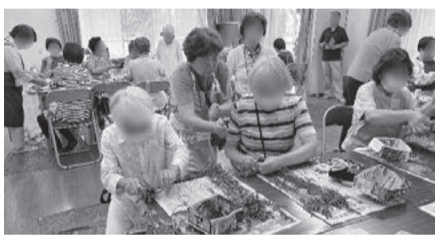
先生のアドバイスのもと、たくさんの方がランタースティックづくりに参加されていました

定員いっぱい20名以上が集まり、楽しく交流を深めながらも、それぞれ思い思いの色の組み合わせで作品を制作していた。大切に育てた植物を見て楽しみ、また違う形で生まれ変わって、今度は身近で香りを楽しめるという、2度の楽しさを味わえるいい企画だ。是非公園手入れのボランティアにあなたも参加してみよう！