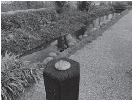
さあ、どこでしょう？