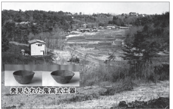
発見された鬼高式土器

その後調査は継続され、平安時代の住居址が発掘されています。廻り田(めぐりた)、後ヶ谷(うしろがや)の地名が残ります。小さな集落が営まれたと推測されます。