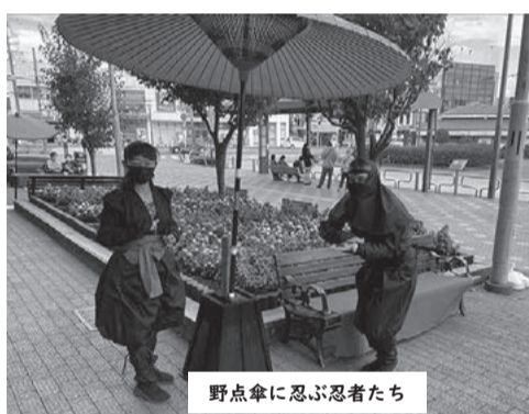
野点傘に忍ぶ忍び者たち